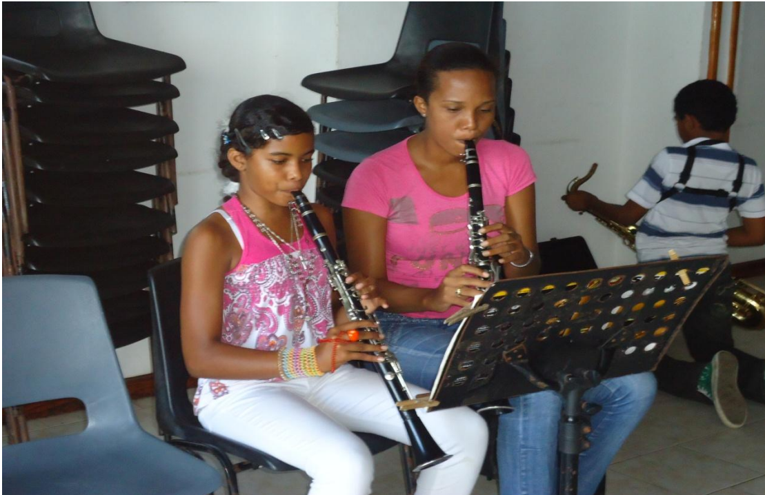
Sede Escuela de música Tom and Selaya