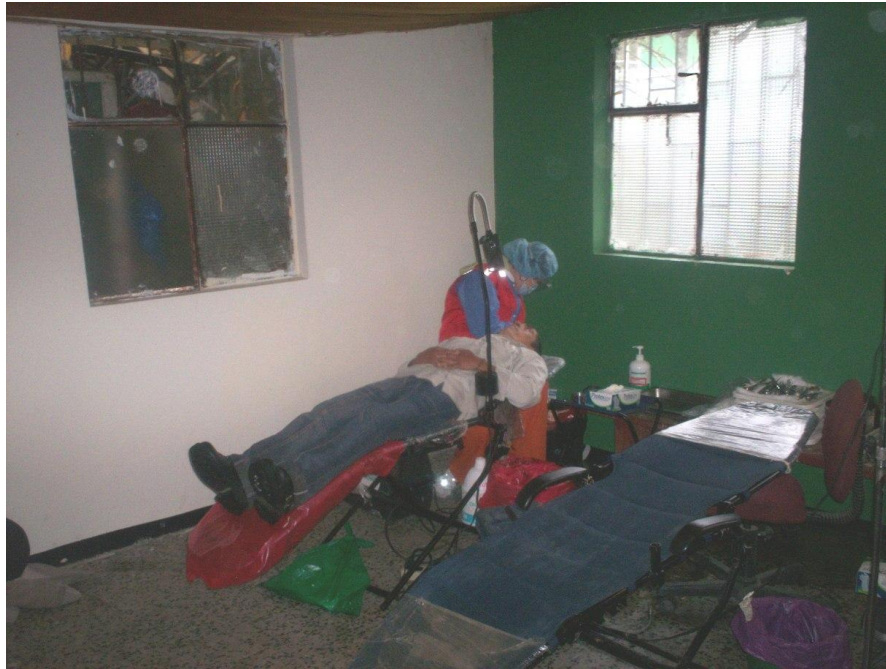
BRIGADA DE SALUD CENTRO URBANO