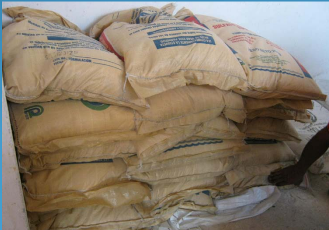
SULFATO DE ALUMINIO