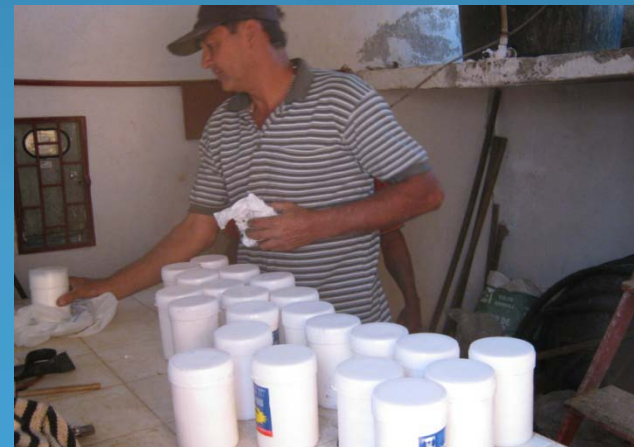
PASTILLAS DE CLORO