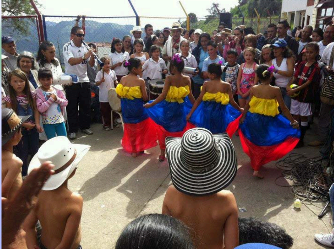
Día del Campesino