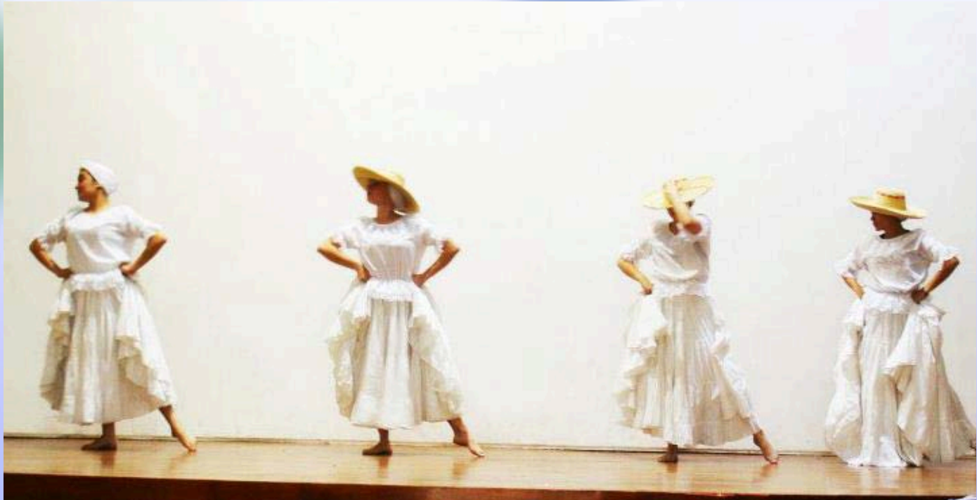
Escuela de Arte - Proyecto