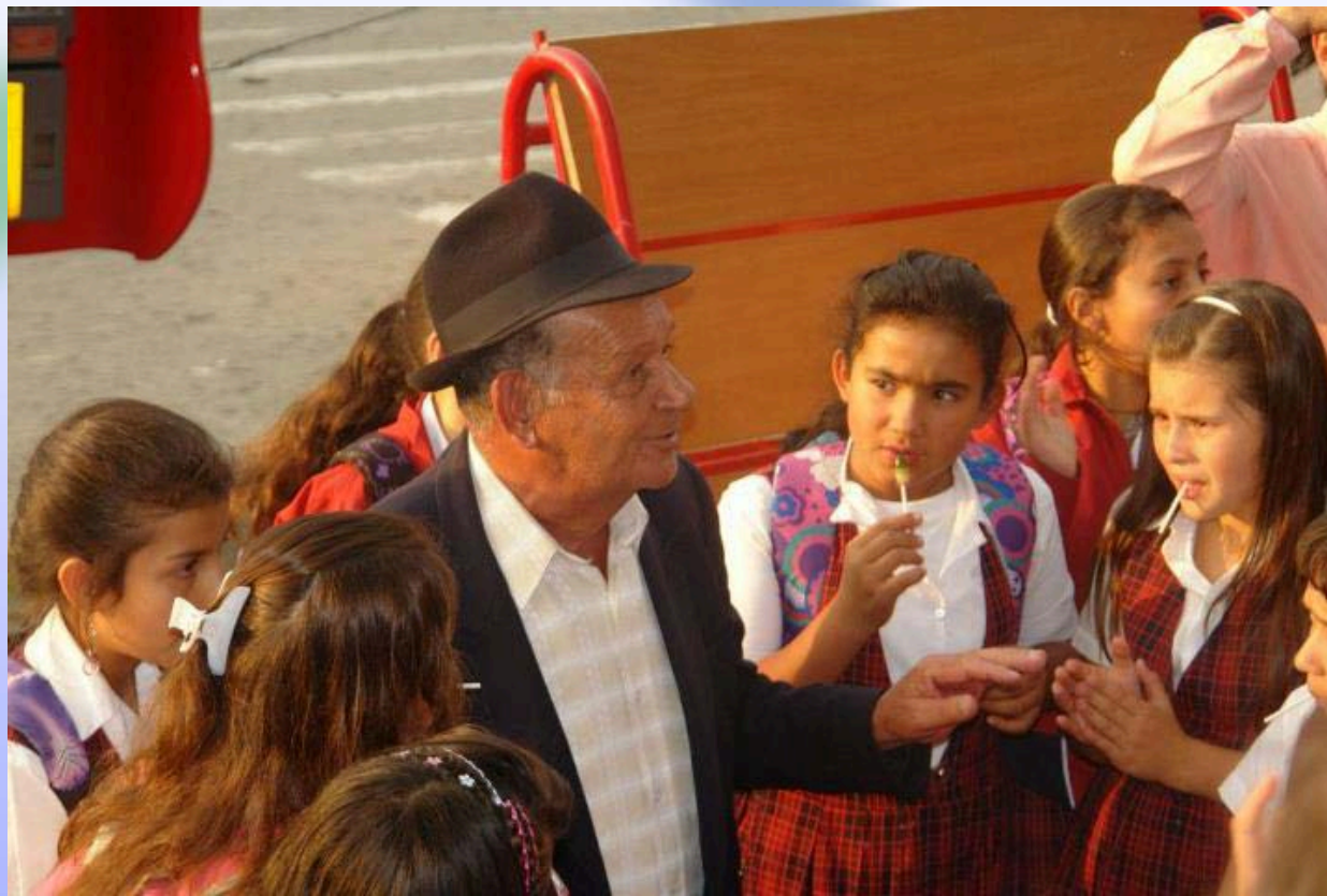
Plan Nacional de Lectura