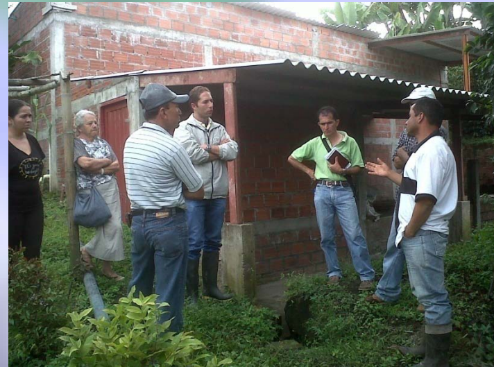
REUNIÓN GESTIÓN DE RECURSOS GOBERNACIÓN Y DPS