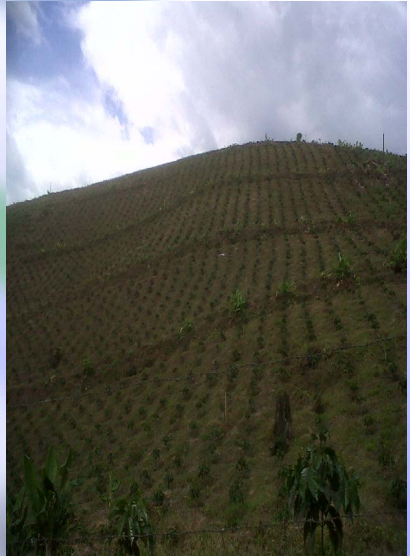
Renovación cultivos de café