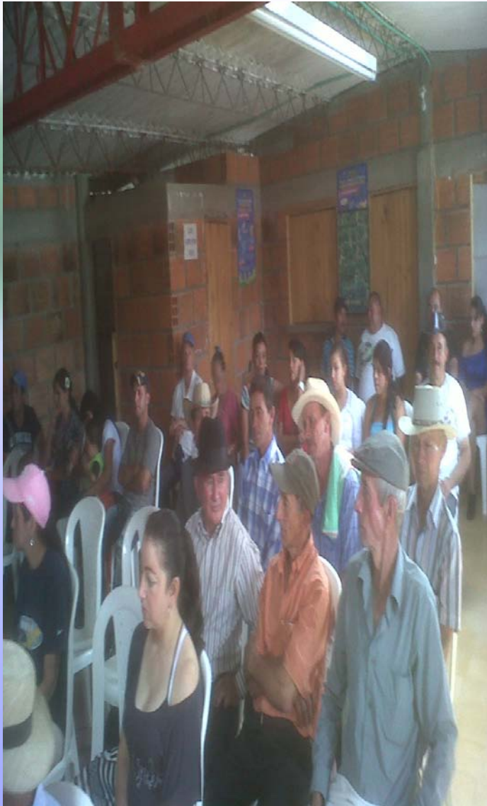
Reunión cafeteros SAN JULIAN