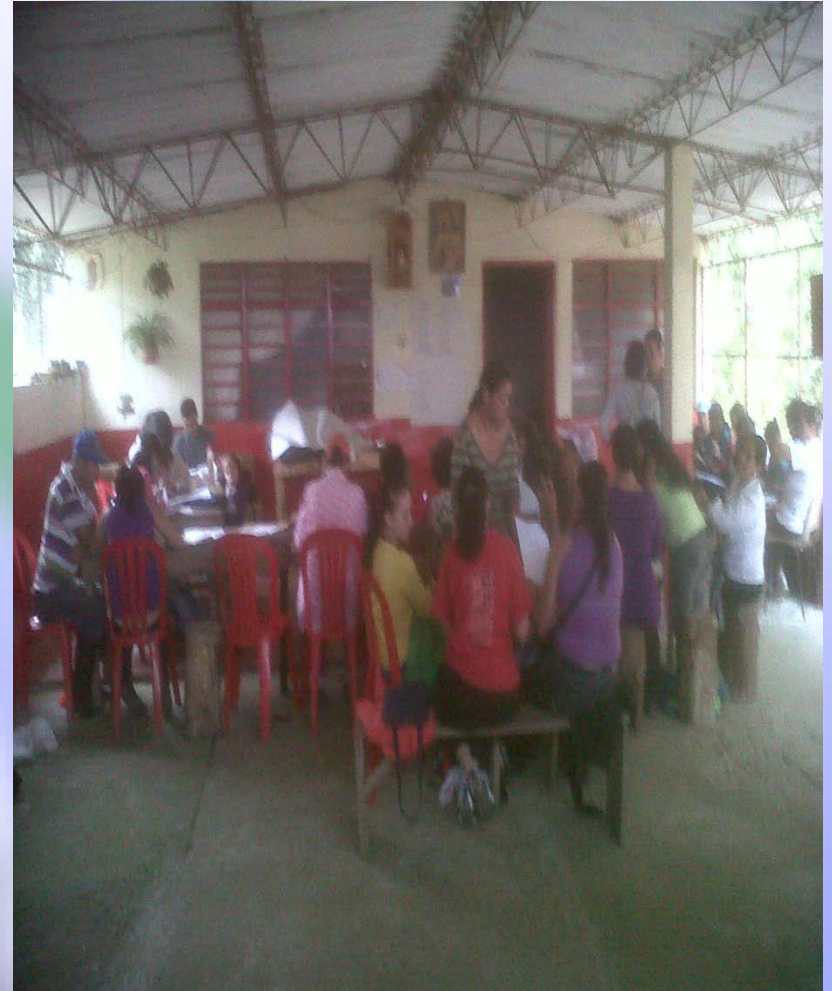
Capacitación al Arroyo