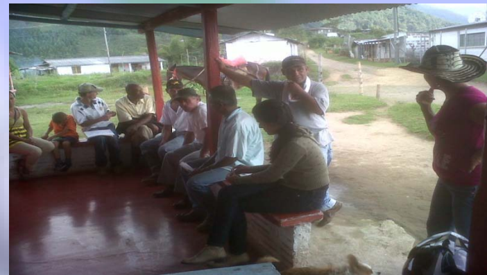
Beneficiarios cultivo de aguacate