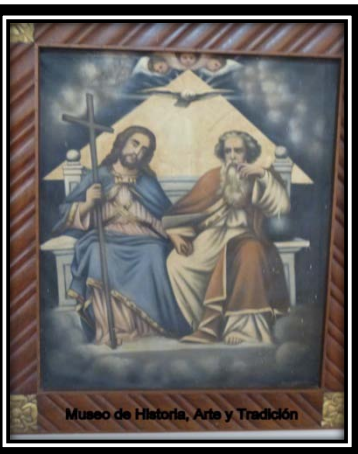
Museo de Historia, Arte y Tradición