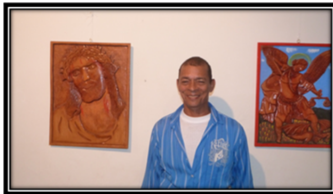
Cuadros tallados en Madera (MDF)

POR EL RIOSUCIO QUE QUEREMOS ¡JUNTOS SI PODEMOS!