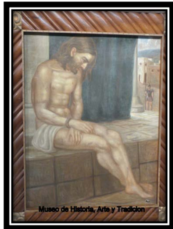
Museo de Historia, Arte y Tradición