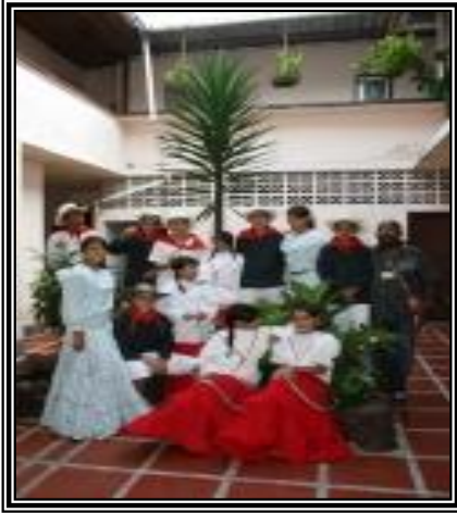
GRUPO DE DANZAS