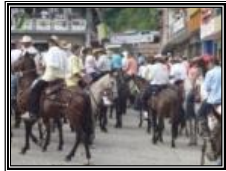
CABALGATA CON LA COMUNIDAD