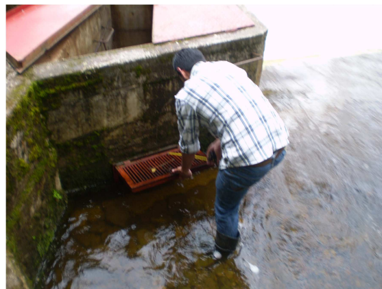
Captación Quebrada Agua Blanca.