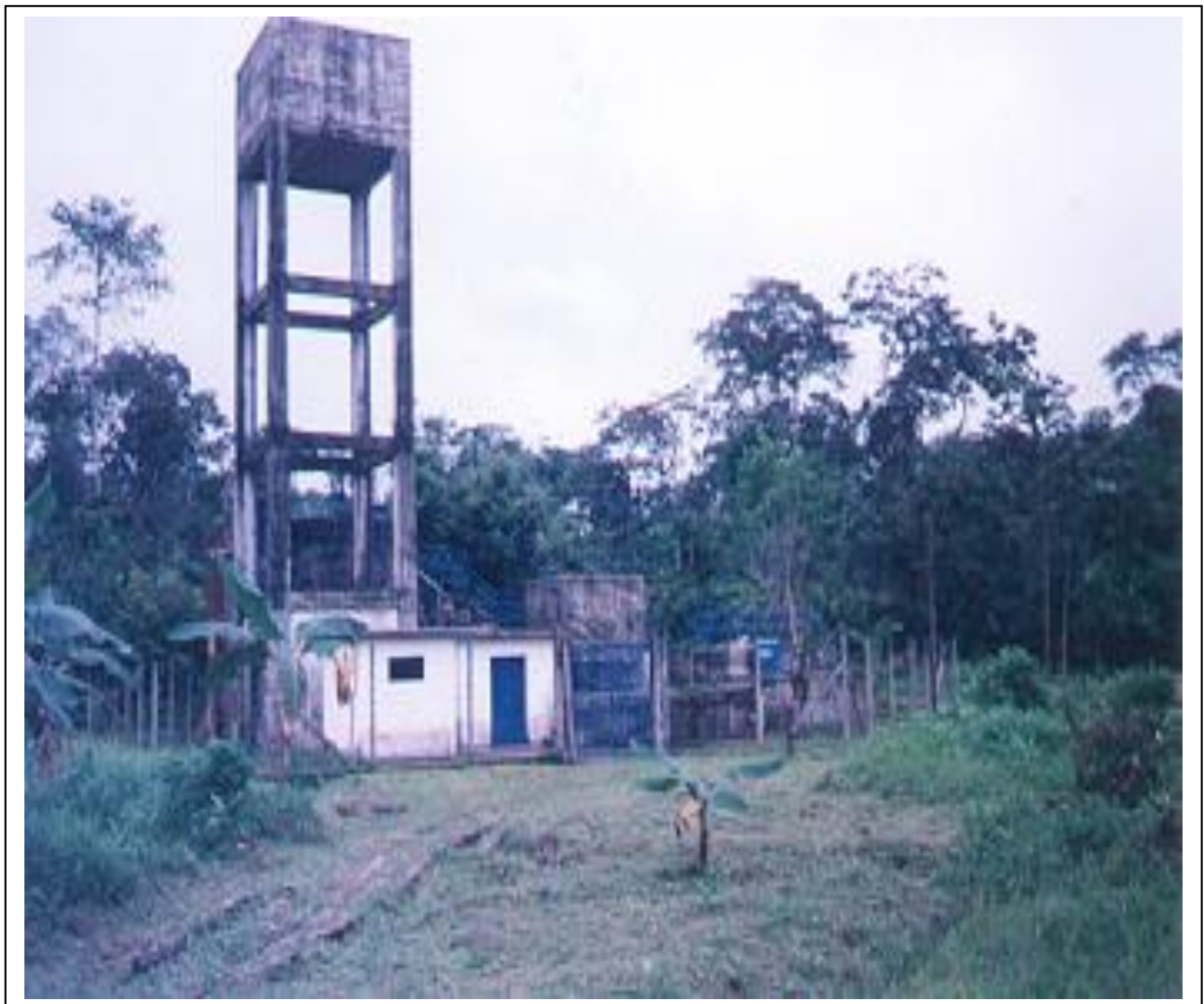
Figura 3: Sistema de Acueducto de la Cabecera Municipal en el Litoral del San Juan

En la cabecera municipal la mayoría de las viviendas poseen tanques de abastecimiento para aguas lluvias, de donde se toma el agua para su consumo diario. Ver Figuras 3 y 4; y Mapa 5. El servicio de acueducto en el área urbana de Santa Genoveva del Docordó esta dirigido y administrado por la Administración municipal, a través de una Junta Administradora conformada por el Señor alcalde quien la preside, el jefe de Planeación y Obras Públicas y un Vocal. La Junta está nombrada para un periodo de tres años. Se impulsa una pequeña organización empresarial denominada ACUADOCORDO, la cual opera desde Julio de 1998. El diagnóstico realizado con la participación de funcionarios de la Empresa, caracteriza técnicamente el sistema actual, con énfasis en la calidad del agua de consumo humano, en la cobertura tratada en términos espaciales como zonas cubiertas por redes de acueducto.