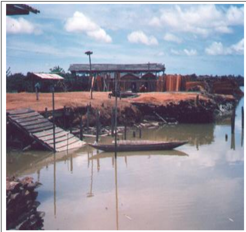
Figura 1: Aserradero de Madera en el Litoral del San Juan.

El proceso se inicia mediante la expedición del permiso de explotación maderable denominado "Salvo Conducto", por el cual el vendedor secundario paga un valor calculado a partir de la cantidad de M3 de aprovechamiento de la madera que se extrae del Municipio; del valor recibido por este concepto, CODECHOCO debe revertir un porcentaje al Municipio.