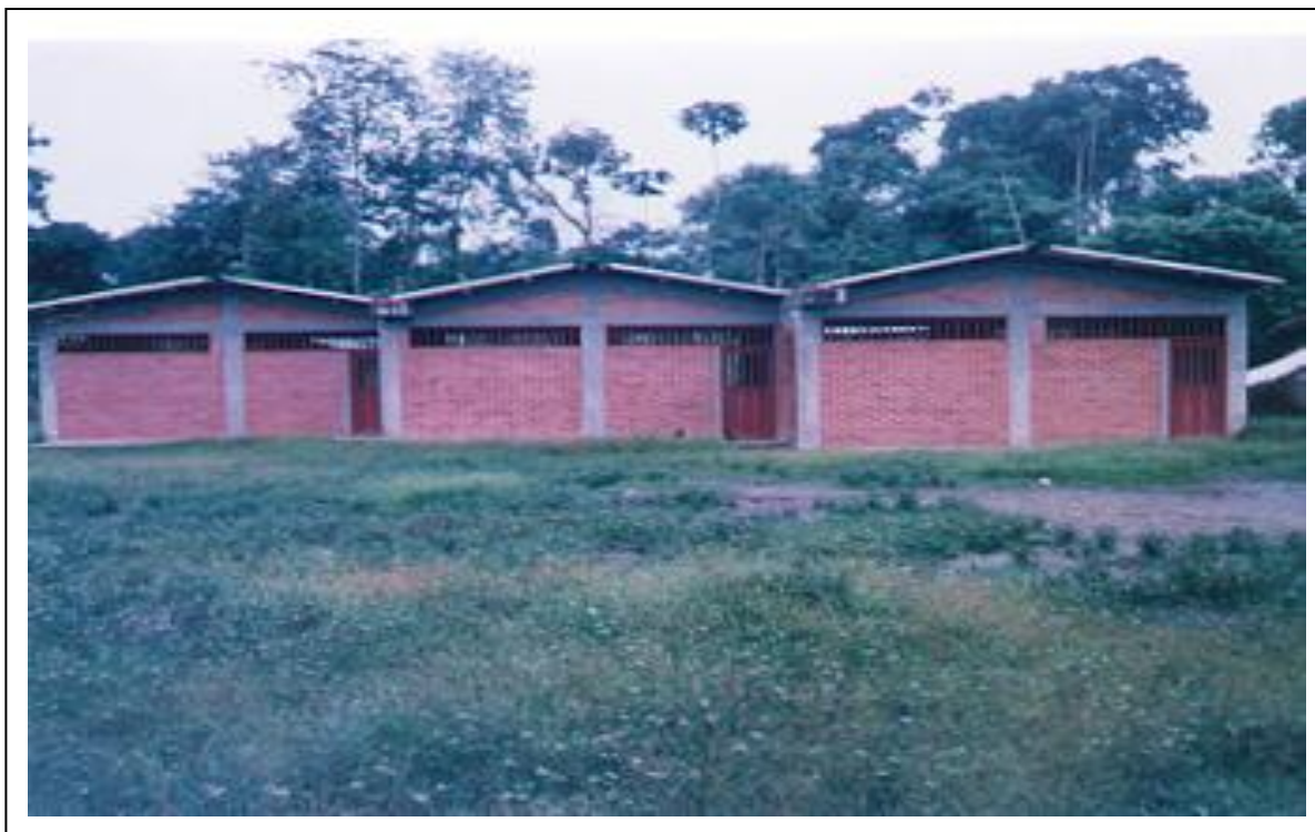
Figura 5: Centro Escolar Corregimiento de Cucurupí (Rural)

Para eso se ha requerido del diseño y desarrollo de un proceso de educación propia desde la identidad cultural, la realidad de las comunidades, sus necesidades y expectativas, a fin de contribuir al rescate, valoración, fortalecimiento de su cultura, el desarrollo de sus propios conocimientos, habilidades y actitudes en pro de su comunidad.