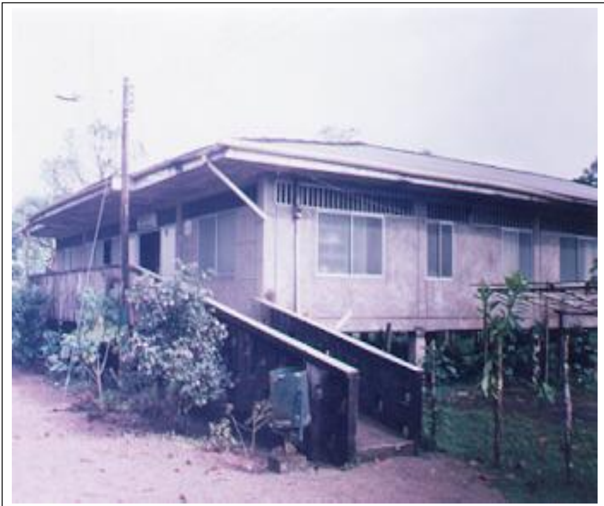
Figura 6: Hospital de Docordó

empresa privada llamada COMUNIPACIFICO, quienes por intermedio de radios de comunicaciones presta el servicio de telefonía por canales públicos permitiendo la comunicación mediante enlace con el sistema de telecomunicaciones Nacional.