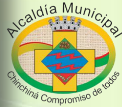
Escuela Juan José Rondón