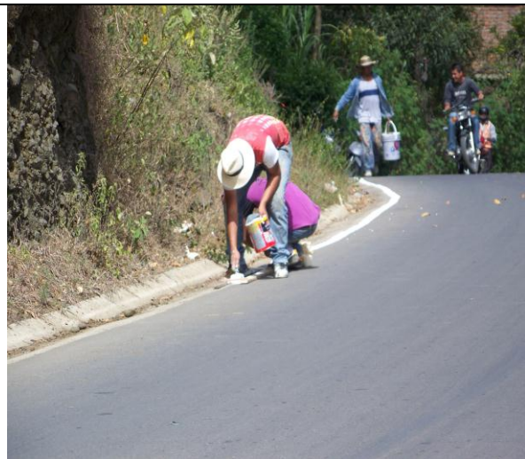
Señalización de la Malla Vial del municipio de El Peñol – Nariño.