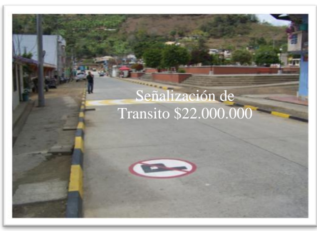
Señalización de Transito $22.000.000