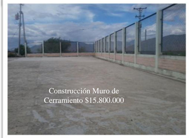
Construcción Muro de Cerramiento $15.800.000