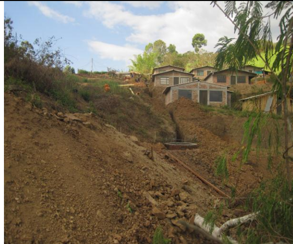
Construcción sistema de alcantarillado Vereda El perejil.