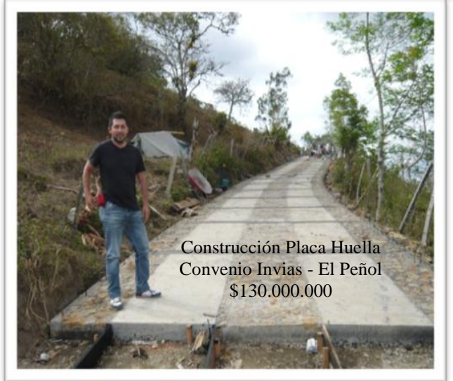
Construcción Placa Huella Convenio Invias - El Peñol $130.000.000