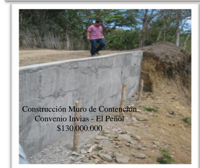
Construcción Muro de Contención Convenio Invias - El Peñol $130.000.000