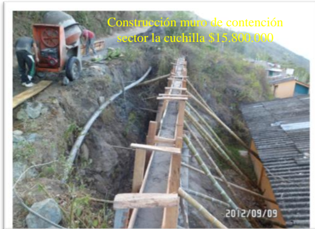
Construcción muro de contención sector la cuchilla $15.800.000