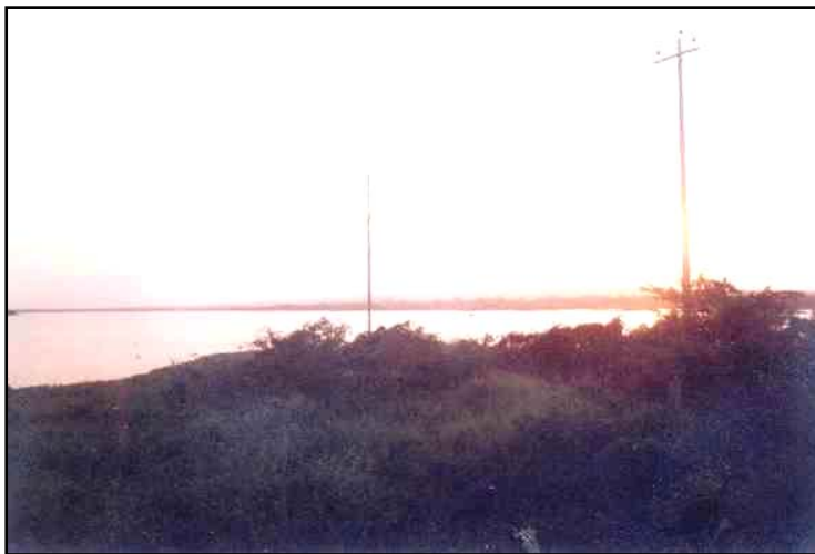
El registro fotográfico muestra en la Foto 2: la panorámica de la Ciénaga la Mosquitera próxima al Corregimiento de Gamboto

procesos de mayor impacto o contaminación visual por degradación del paisaje.