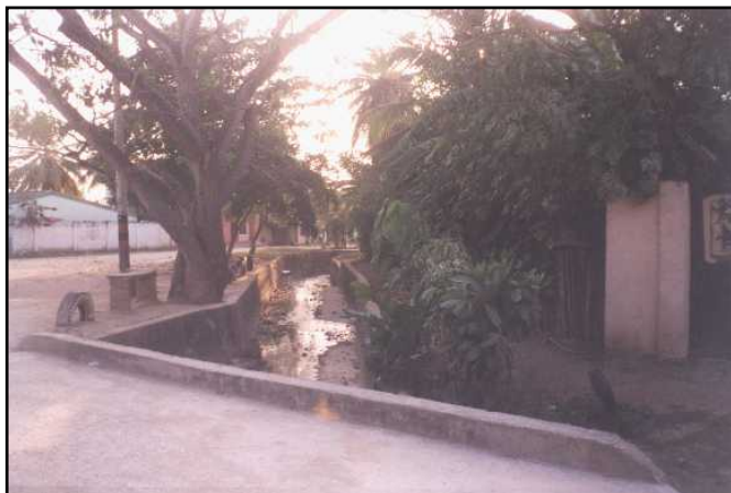
• Eje Canalizado del Arroyo Cuza

Humedales en el Casco Urbano Castilla, Guardo, Carballo, Nene Castro, María del Bongo, la Zuqui, y Caimical