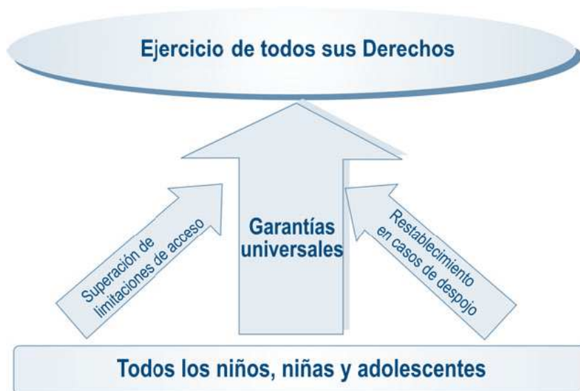
Ilustración 1 LOS TRES EJES DE LA POLÍTICA PÚBLICA DE INFANCIA Y ADOLESCENCIA

El eje central son las garantías universales básicas. Las garantías universales son el soporte principal del enfoque de derechos. Estas garantías de los derechos se plasman en servicios