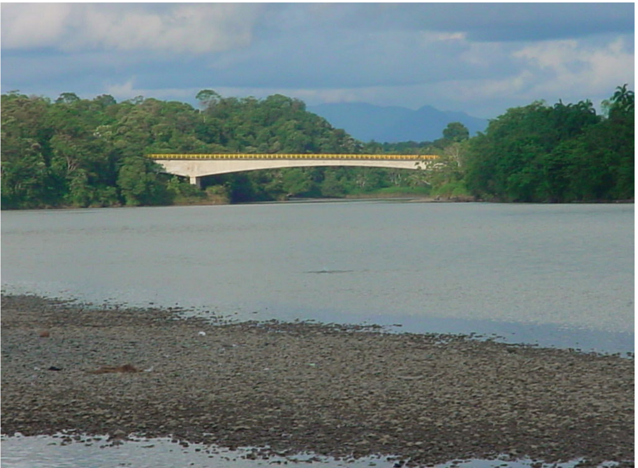
Puente de Yuto