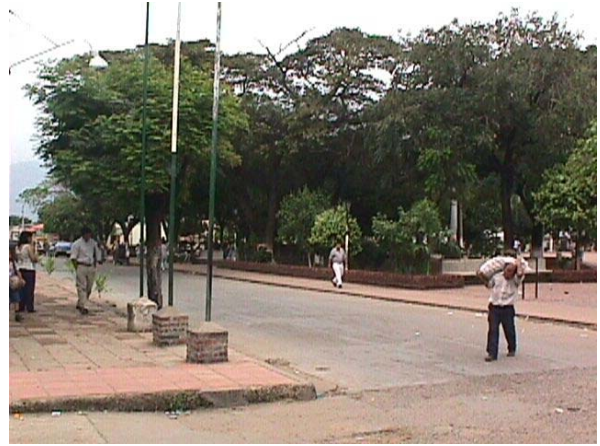
CALLE 4 Y PARQUE PRINCIPAL.