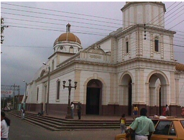
CARRERA 7 CALLE 7. IGLESIA PRINCIPAL