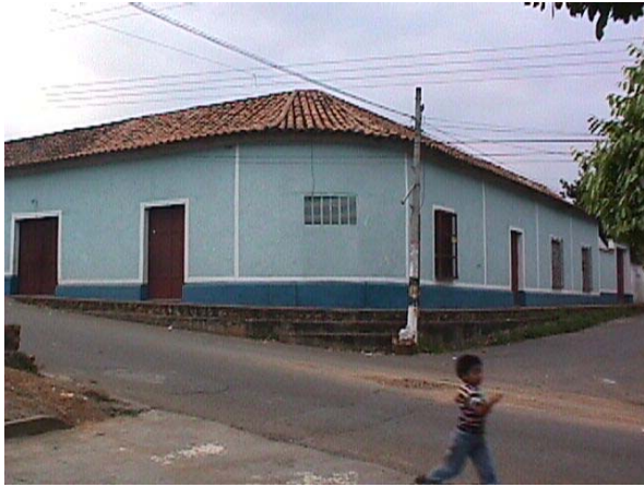
CASA ESQUINA CURVA , CALLES 7.