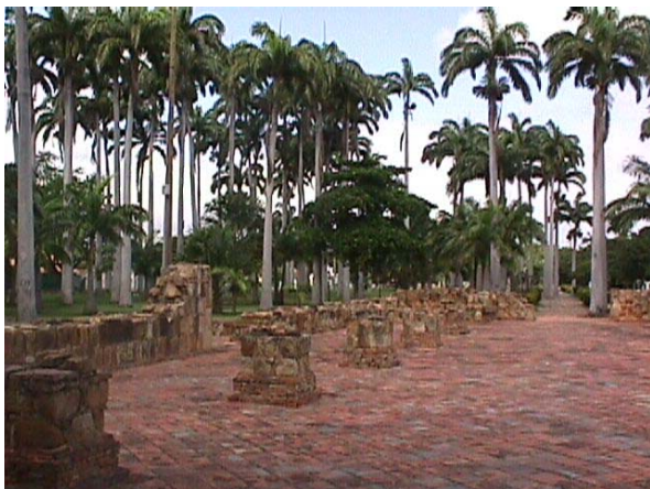
VISTA DE LAS RUINAS Y LAS PALMERAS