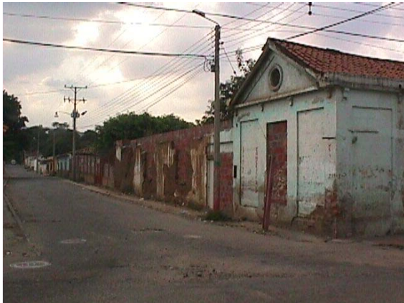
CALLE 7 CON CRA 1. ESTACION DEL FERROCARRIL