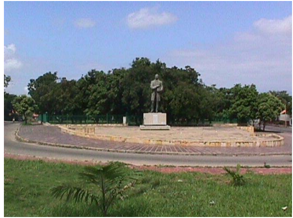
ESTATUA DE SANTANDER , PARQUE HRANCOLOMBIANO