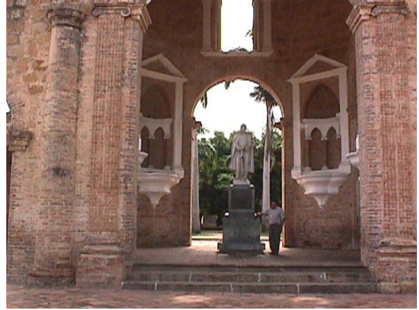
ESTATUA EN EL INTERIOR DEL TEMPLO HISTORICO