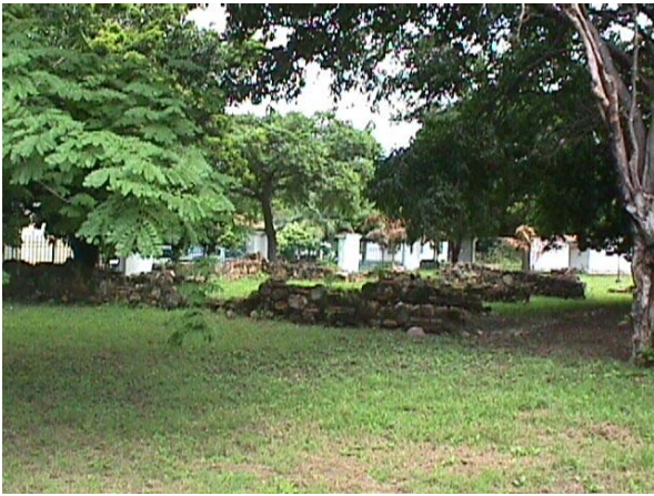
RUINAS CAPILLA DE SANTA RITA.