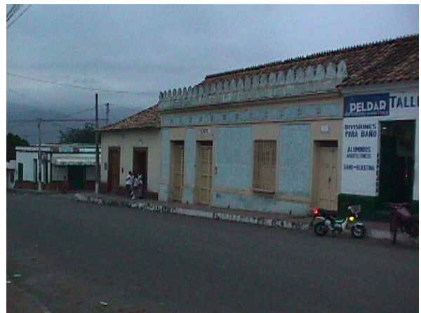
INMUEBLE EN LA CALLE 7 ENTRE CRA 6 Y 7.