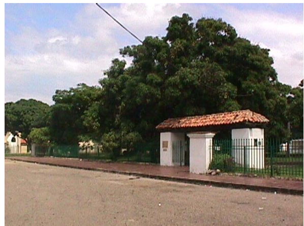
ENTRADA A LAS RUINAS CAP. SANTA RITA.