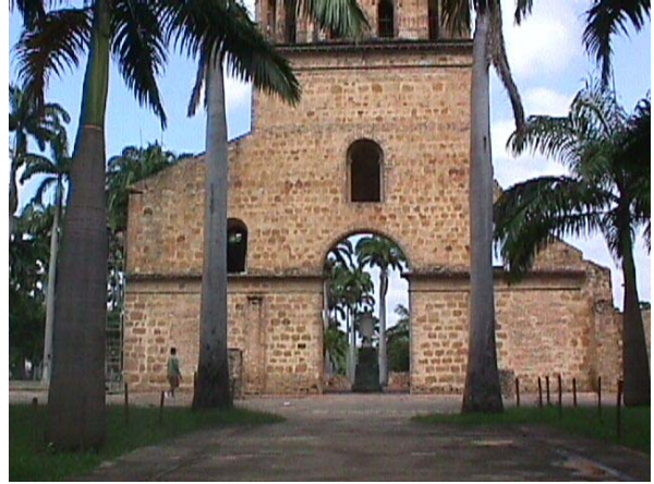
DETALLE PARTE INFERIOR DEL TEMPLO.