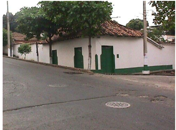
CALLE 7 CRA 4. ESQUINA NOR-OCCIDENTAL