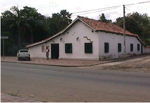
EXTERIOR , CASA DE GOBIERNO LA BAGATELA