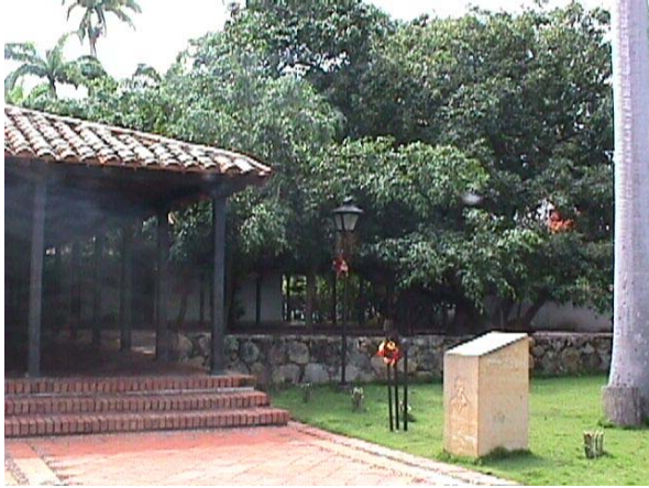
DETALLE INTERIOR DEL PARQUE.