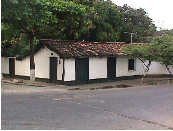
CALLE 7 CRA 4.ESQUINA NOR-ORIENTAL