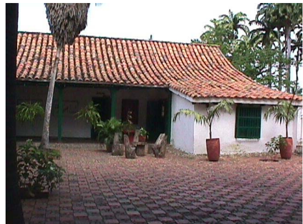
PATIO INTERNO CASA DE GOBIERNO LA BAGATELA.