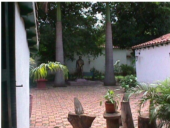
ESTATUA DE ANTONIO NARIÑO, EN LA CASA DE GOBIERNO LA BAGATELA.