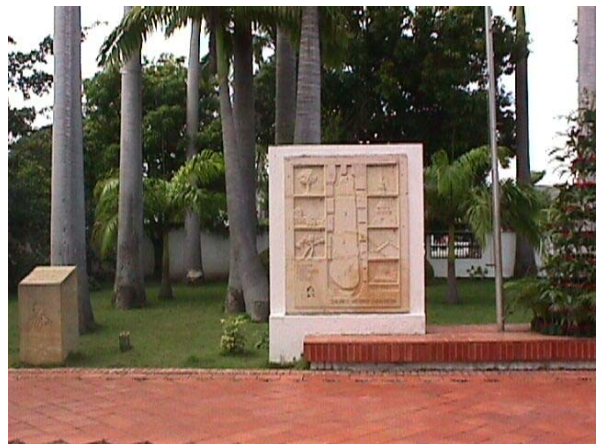
GRAB. EN PIEDRA DE LA ZONA DEL PARQUE.