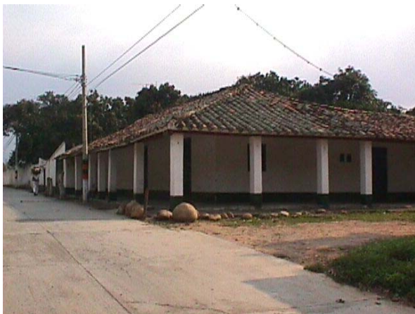
CALLE 8 CON CARRERA 4