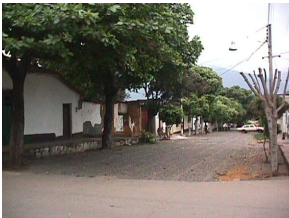
CALLE EMPEDRADA , 5 CON CARRERA 6