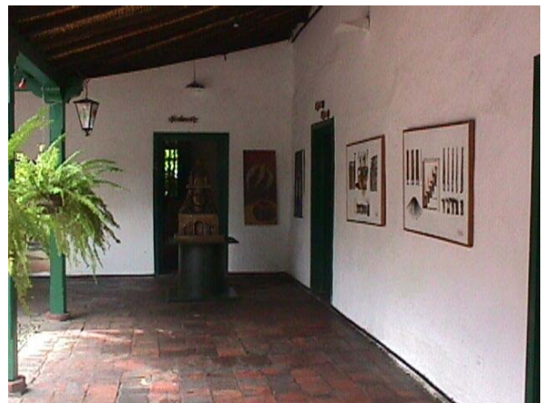
CORREDOR INTERNO CASA DE GOBIERNO LA BAGATELA.