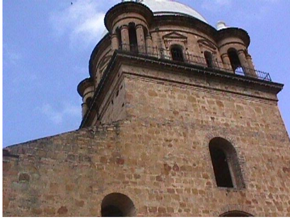
DETALLE CUPULA SUPERIOR DEL TEMPLO.