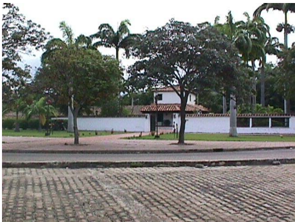
VISTA DE LA ENTRADA AL PARQUE