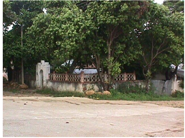
INMUEBLE EN LA CRA 4