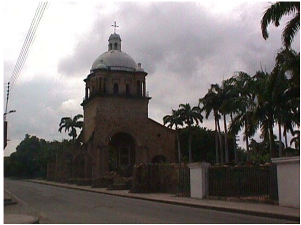
VISTA TEMPLO HISTORICO.