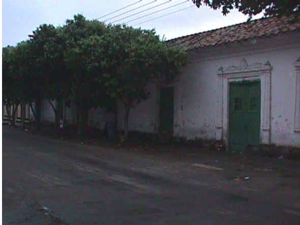
CASA DEL TUNEL