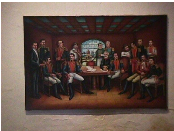
CUADRO , JUNTA DE GOBIERNO