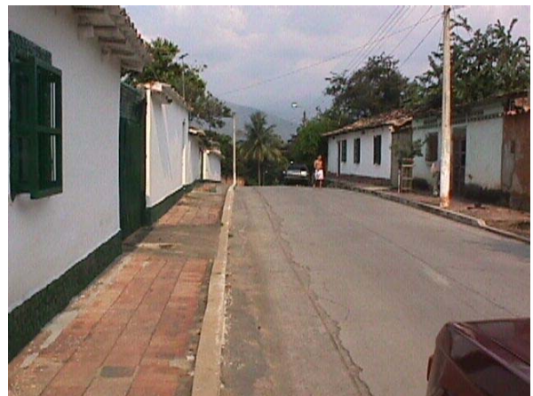
CALLE 10 ENTRE CRA 2 Y 3.