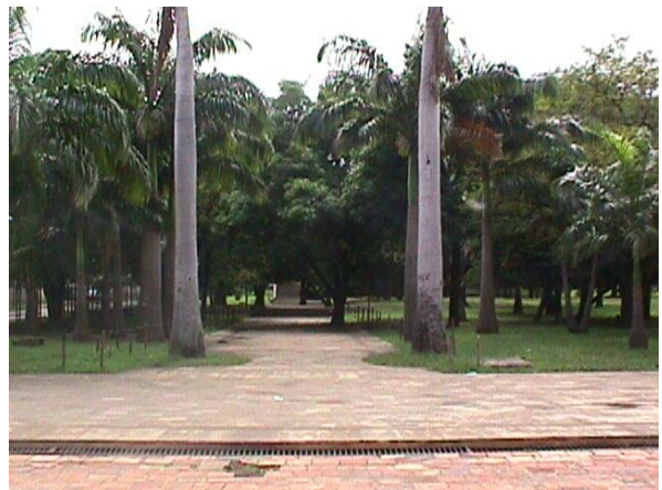
VISTA INTERIOR DE LA ZONA VERDE