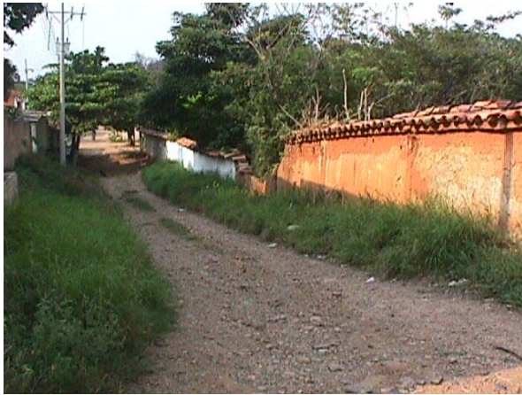
CRA 2 ENTRE CALLES 9 Y10.