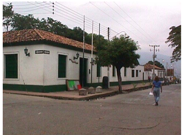
CASA DE LA CULTURA , CLLE 4 , CRA 8.