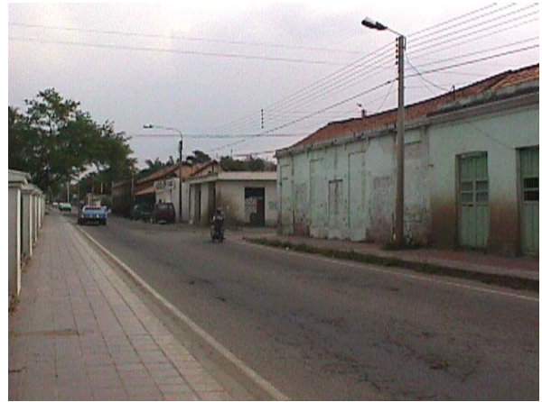
CRA 1 , O AUTOPISTA INTERNACIONAL ESTACION DEL FERROCARRIL.