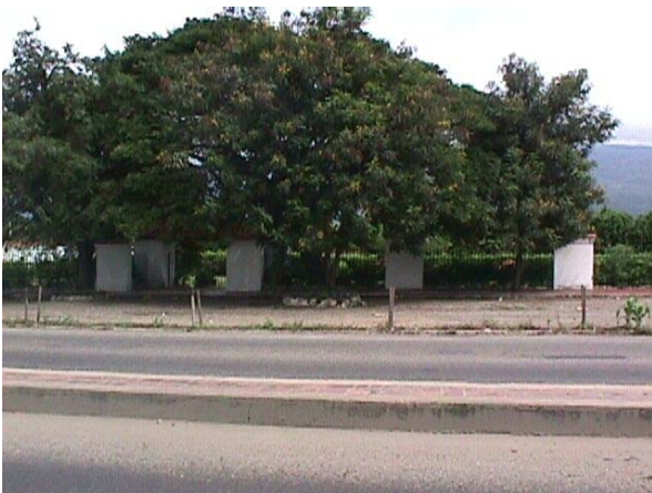
SITIO EL TAMARINDO