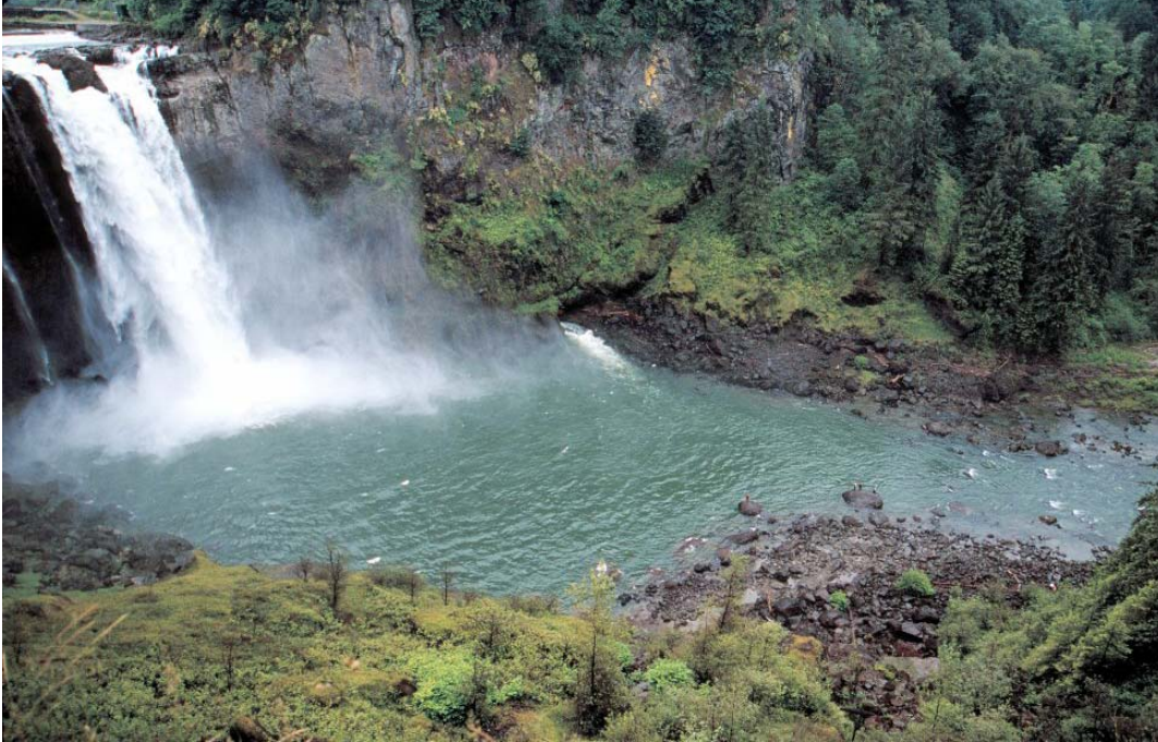
Fuente natural. Río Murca