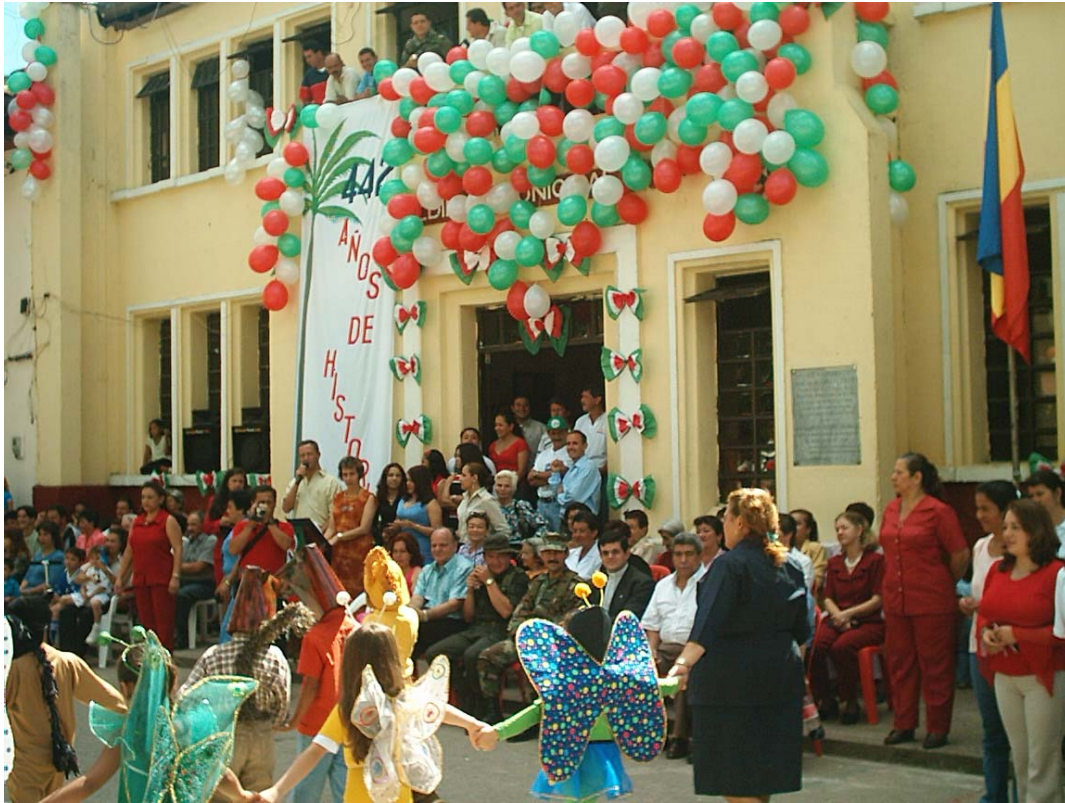
442 años de La Palma. 19 de noviembre de 2003.