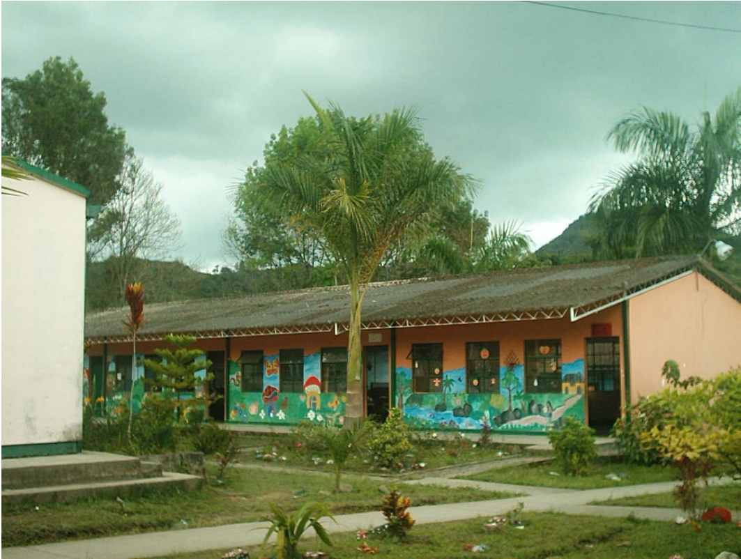
Concentración Escolar Jhon. F. Kennedy

así lo exige, puesto que no es una acción ni un logro institucional sino una propuesta municipal.