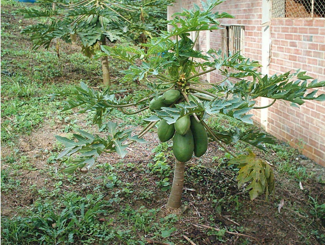
Frutales. Granja Municipal