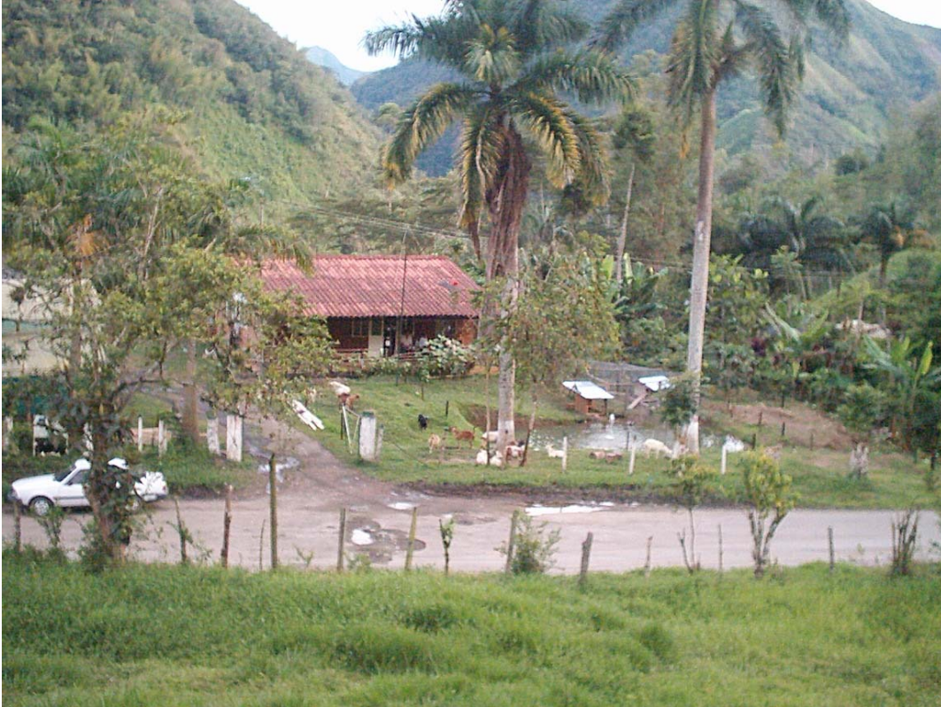
Granja Municipal. Experimental piloto.

Los suelos son de vocación agrícola, pecuaria y forestal existiendo problemas erosivos provocados por factores naturales y de deforestación, falta de tecnología apropiada para su uso, pérdida de la capa vegetal, sobreutilización y uso de agroquímicos.