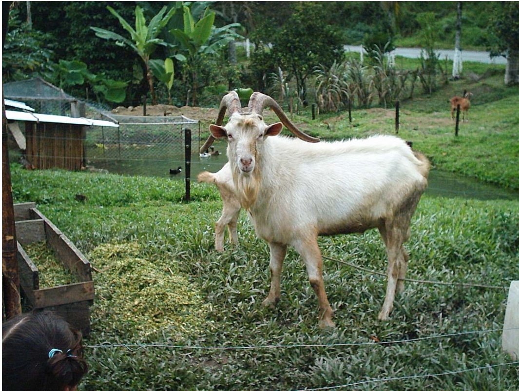
Ejemplar caprino Granja Municipal

Por tradición la feria agropecuaria se realiza en el mes de agosto de cada año, sin embargo se nota decadencia en su importancia, por el conflicto social y otro por la vocación agrícola o pecuaria en la explotación del campo.