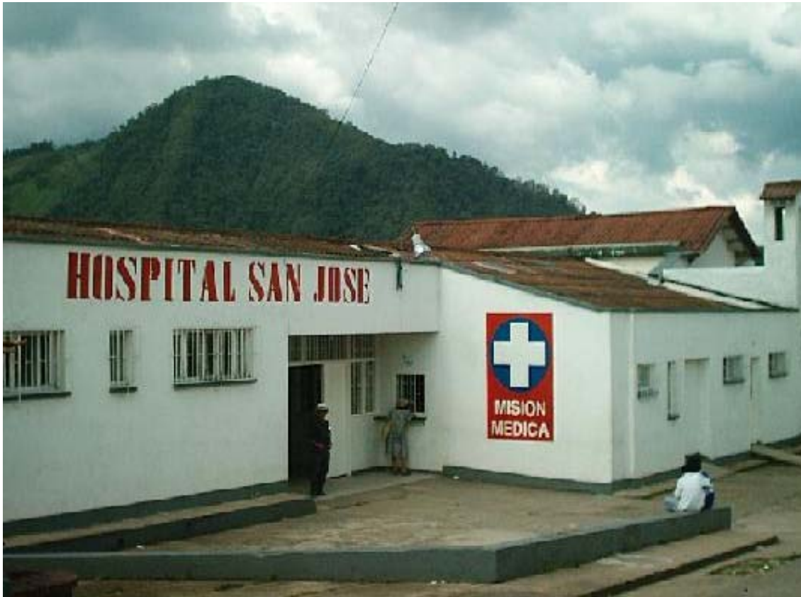
Fachada Principal. Hospital San José

El Hospital requiere el AJUSTE- REESTRUCTURACION. Se efectuó un análisis arrojando como resultado que para la continuidad del Hospital, se deben suprimir 30 cargos y para ello se requiere de UN MIL TRESCIENTOS CINCUENTA MILLONES DE PESOS M.L. (1.350.000.000.oo).