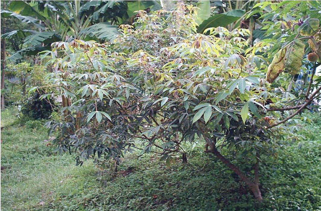
Yuca. Producto propio de nuestra región. Granja Municipal

En la granja municipal se implementará un vivero forestal para facilitar el acceso del campesino a especies nativas de protección y especies maderables.