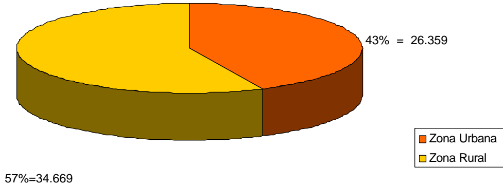
Figura No. 2 Población Total del Municipio de Garzón

Se registran en el municipio de Garzón 11970 familias y 11236 viviendas.