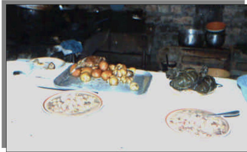
Fotografía 16.4 Platos típicos de Guacamayas (mute, tamales, papas).

En el cuadro 18.1, se resume la receta para la elaboración de algunos de los platos y bebidas y comidas típicos del Municipio.