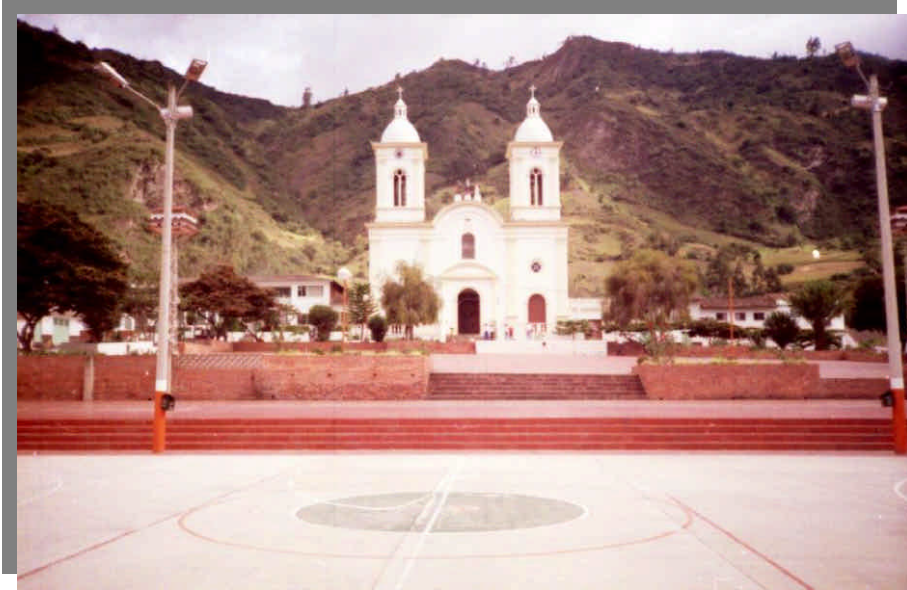
Fotografía 16.1. Templo principal de Guacamayas.