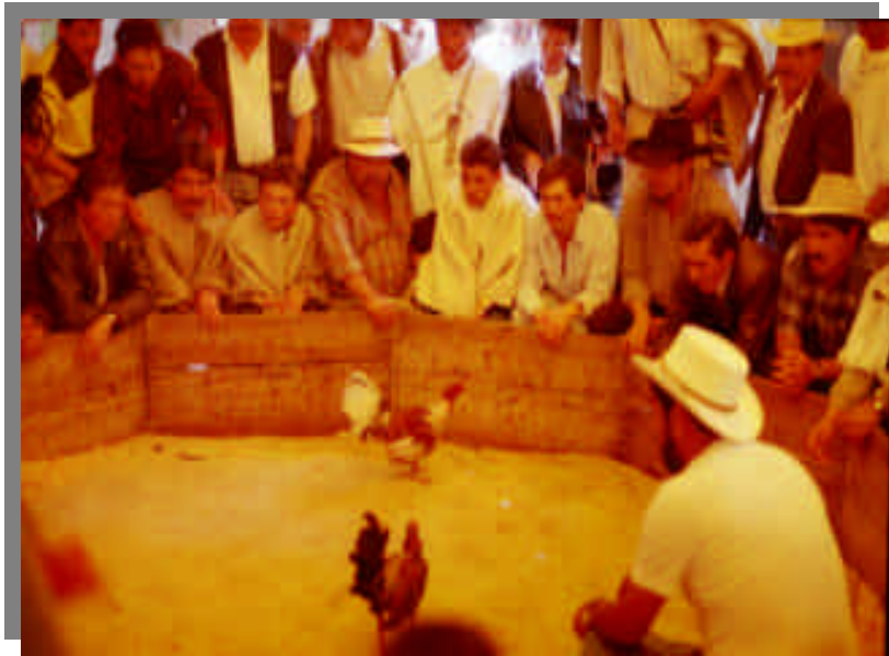
Fotografía 16.6. Pelea de gallos: Actividad, evento típico de los guacamayeros.