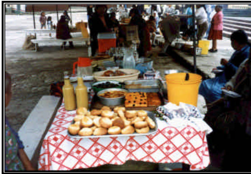
Fotografía 16.5. Calados, pastel de papa, de ahuyama, masato y dulce de brevas.

16.2.16. Medicina tradicional. En Guacamayas tiene buena acogida la medicina tradicional, utilizada principalmente por el nivel cultural, por la baja credibilidad hacia las instituciones de salud y por el difícil acceso a la medicina especializada (especialistas). Son frecuentes parteras y sobanderos.