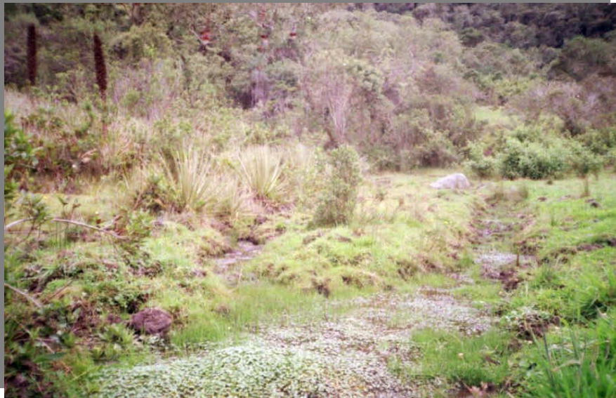
Fotografía 16.1. Pozo Bravo: Lugar de Nacimiento de la Quebrada Surcabásiga.

Mi mamá también dice que esto es cierto, que le consta, que en cierta ocasión, un domingo, cuando sus papas bajaron al pueblo para traer el mercado y la habían dejado sola con un hermano, encontraron un marranito, que lo amarraron debajo de la cama para tenerle la sorpresa a los abuelos. Cuando ellos subieron al día siguiente porque les gustaba quedarse a tomarse sus guarapos con los amigos, al ir a mostrarles el marrano ya no estaba, solamente el mero lazo. Siempre veían salir culecadas de pollos de la laguna y todo eso.