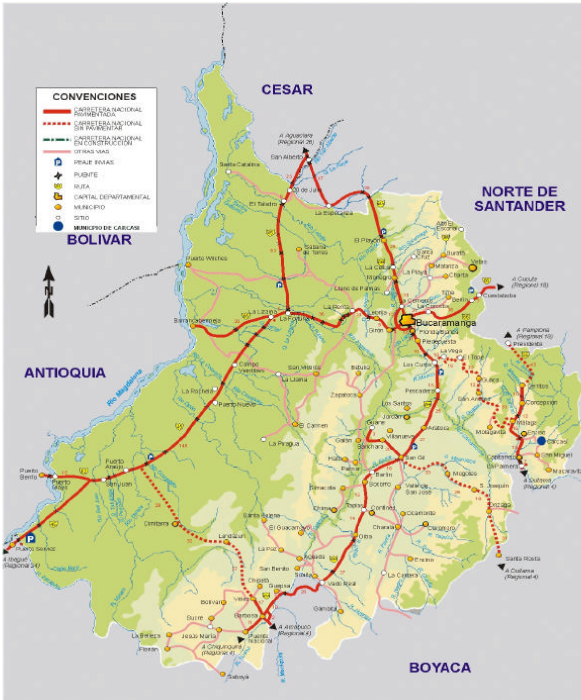
MAPA 1: Lo calización geográfica de Carcasí

“Para que los campesinos gobiernen por la senda del progreso; porque el gobierno es de ustedes”