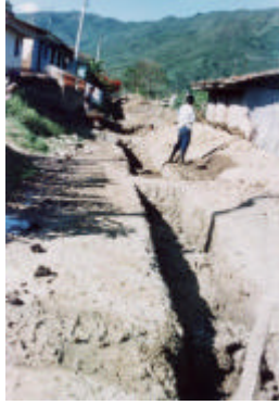
Fotografía - construcción de Alcantarillado pluvial, Barrio Belén.