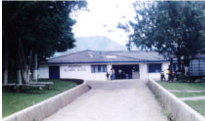
Fotografía Hospital Álvaro Ulcué.