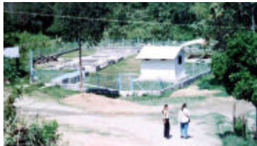
Planta de Tratamiento, PTAR, Río San Francisco.

5.2.5 Recreacional. Este uso tiene un porcentaje intermedio de ocupación, comparado con el área de la cabecera municipal, la administración municipal y la comunidad ha posibilitado la creación de escenarios para el esparcimiento.