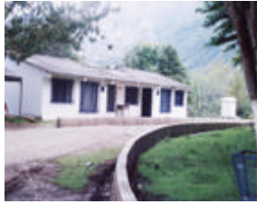
Foto - Casa de paso Hospital Álvaro Ulcue.

A nivel de talento profesional y calidad del servicio, la comunidad tiene una visión positiva sin embargo se hace necesaria la ampliación de personal medico para garantizar la presencia estable de médicos y auxiliares las 24 horas del día.