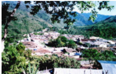
Foto - Vista panorámica de la Cabecera Municipal de Toribio

El Municipio de Toribio está situado al nororiente del Departamento del Cauca, limitando por el norte, con el Municipio de Corinto; por el oriente, con Municipio de Páez y el Departamento del Tolima; por el sur y sur occidente, con el Municipio de Jambaló y por el occidente con el Municipio de Caloto. El territorio municipal comprende alturas que oscilan entre los 1300 y los 4100 m.s.m. Tiene una extensión de 49.143 hectáreas y una población de 26.594 habitantes.