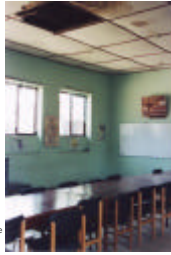
Fotografías - Deterioro aulas de clase.

A nivel general la planta física presenta un regular estado, sin embargo en algunos sectores hay notables deficiencias y riesgos que deben atenderse prioritariamente e inmediatamente, dentro de los aspectos negativos se identificaron: