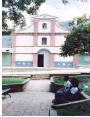
Fotografía Iglesia de Toribio.

5.3.1 Hitos. Estos elementos hacen parte de la memoria urbana de Toribio, sin ser elementos naturales o arquitectónicos imponentes, tienen mucho significado y simbolismo para la comunidad, radicando ahí su verdadero valor Urbano.