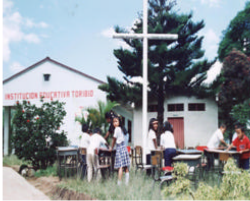
Fotografía - Institución educativa Toribio.

A continuación se localizan puntualmente los sitios y establecimientos que hacen parte de la actividad diaria de los habitantes de la Cabecera Municipal. (Véase Plano 2/11 de Equipamiento Urbano).