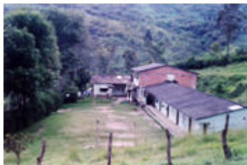
Foto - Institución Educativa Toribio - Barrio Belén.