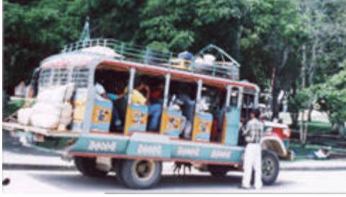
Foto - Medio de transporte intermunicipal.

salida y llegada al centro urbano, así como el número de rutas establecidas diariamente.