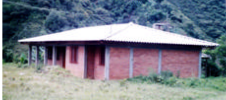
Casa Médica, Hospital Álvaro Ulcue.

Las áreas húmedas como patios de ropas y cocinetas requieren de un mejoramiento para evitar el deterioramiento de la planta física.