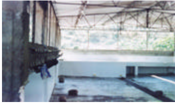
Foto- Central de Sacrificios de Toribio.

instalaciones adecuadas para el sacrificio de ganado y con un sistema de tratamiento propio para las aguas residuales. (Véase en el Capítulo de Uso del Suelo y Áreas de Actividad Propuesta, el ítem Área de Servicios Municipales (ASM).