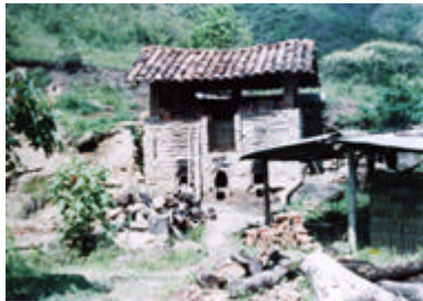
Fotografía. Construcción de lo que fue en otra época un "galpon ladrillero".

5.2.7 Industria Artesanal. Existen edificaciones que en épocas pasadas fueron dedicadas a la producción del ladrillo denominadas "galpones ladrilleros", las cuales posibilitaron la fabricación de este producto para promover la construcción de vivienda.