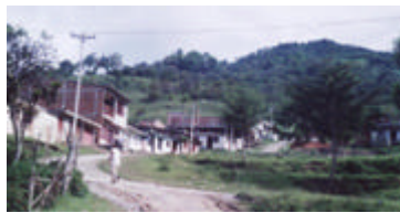
Panorámica del Barrio El Coronado.

Como territorio Urbano, la trama urbanística de Toribio ha tenido un desarrollo consecuente con sus necesidades, sin embargo su trazado vial no ha sido sensible con su entorno natural, la trama no es consecuente con la direccionalidad y forma de los ríos que la bordean. Aunque actualmente se está edificando sobre la falda de los cerros localizados al sur de la población, la trama sigue conservando la Ortogonalidad.