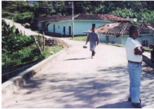
Foto --Via Arteria principal --salida a Tacueyó.

Existen cuatro tipos de vías dentro de la Cabecera Municipal que se identifican en el Plano 5/11 de Vialidad y Transporte.