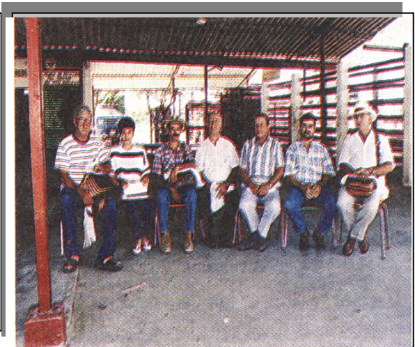
Fotografía 3. Plaza de Ferias de Puerto Boyacá Fotografía 4. Representantes de la Directiva

Una vista de la Plaza de Ferias, sus corrales construidos en concreto reforzado y tubería de acero de enorme resistencia para controlar la fuerza del ganado. Un grupo de directivos acompaña las actividades.