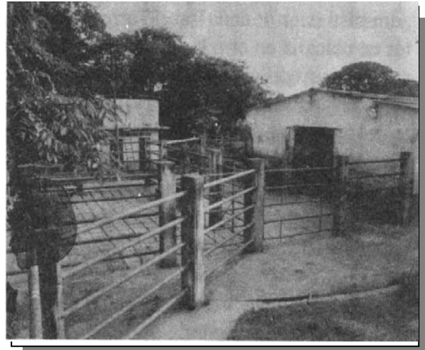
Fotografía 2. Segunda Etapa Matadero

Contraste entre del Matadero en su primera etapa y lo que hoy se puede ver. De un lado el primer matadero, con sus instalaciones elementales, en materiales modestos, no obstante, algunos parroquianos acompañan la labor. Por otro lado, la segunda etapa, unas instalaciones más sofisticadas y con una buena infraestructura.