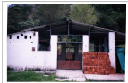
FOTO N. 24 PLANTA DE SACRIFICIO DE GANADO, CASCO URBANO.