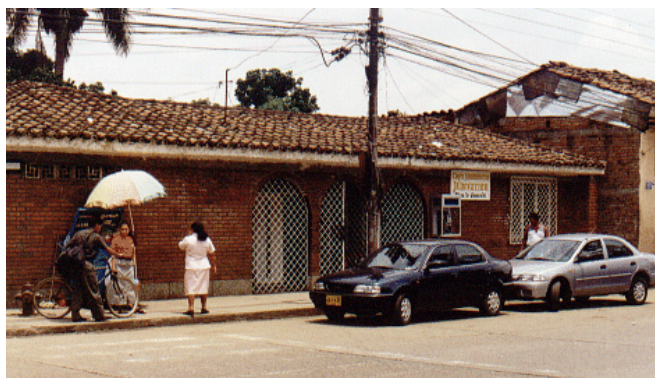
Foto 4 Planeación Municipal

Actualmente las oficinas de la administración municipal se encuentran dispersas las unas de las otras y aunque el edificio de la alcaldía se está remodelando este no es suficientemente grande como para albergar todos los departamentos de la administración, por dicho motivo es necesaria la construcción de un centro administrativo municipal.