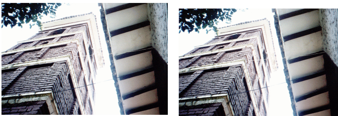
Foto 7 Iglesia católica.