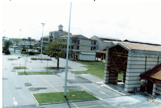
Fotos 2 y 3 Centro comercial Alfaguara

La cabecera municipal cuenta con una oficina de Telecom, cuenta además con las siguientes instituciones: Notaría Única de Jamundí, una (1) Registraduría, la oficina de UMATA y la oficina de Desarrollo Comunitario.