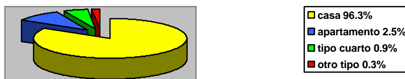
Gráfica No. 3 Porcentajes de tipo de vivienda. Dane – Censo de 1993.

Este factor presenta, de acuerdo a los datos estadísticos del Dane, el alto porcentaje de habitantes con unas óptimas condiciones de habitabilidad, el hecho de ser propietario del predio, de poseer una vivienda en buenas condiciones espaciales ya que se da un desarrollo en tipo casa de uno o dos pisos, sumado a la ocupación en alto porcentaje de un sólo hogar dentro de cada una de ellas, son evidencias claras del proceso de consolidación de la cabecera urbana y de la capacidad de adquisición del habitante “Zapatoca”.