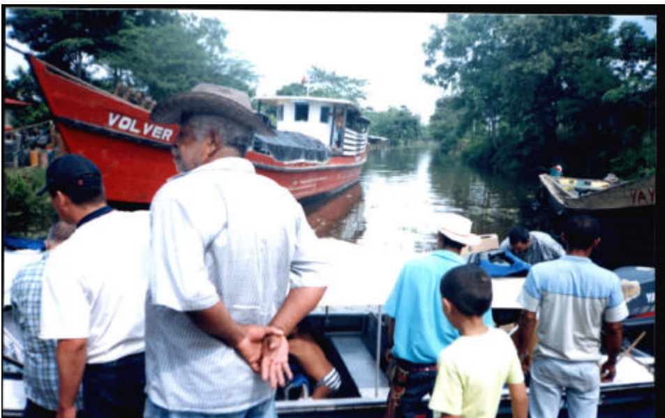
Canal de acceso a Unguia