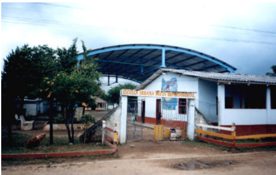
Escuela en Unguia