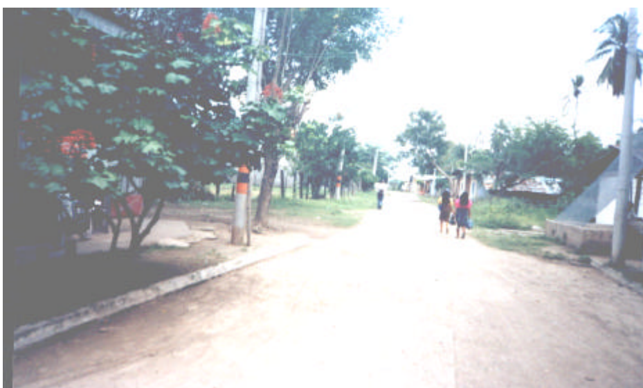
Calle en Unguia

Dentro del casco urbano se identifican dos ejes viales que sobresalen por su utilización y funcionalidad que son las vías principales, que son la Carrera 3ª y la Calle 4ª .