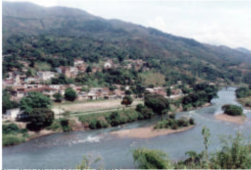
Cabeceira Municipal, Municipio de Suárez.