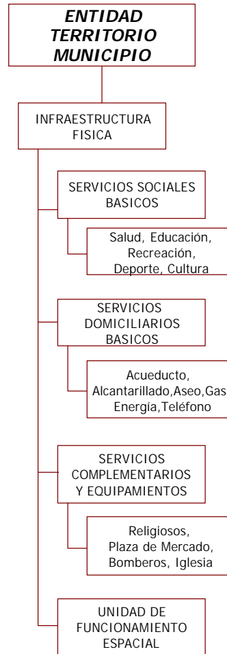
GRAFICO No. 9 . Componentes del Subsistema Funcional – Espacial