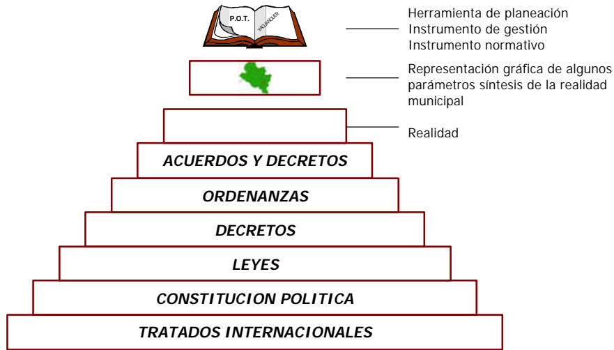
GRAFICO No. 3. Articulación Plan de Ordenamiento Territorial con el Plan de Desarrollo Municipal