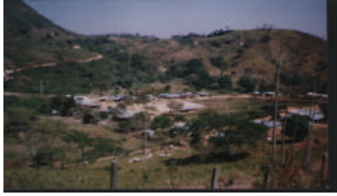
Fig.#. Panorámica de San Isidro

El corregimiento de San Isidro cuenta con dos cuencas hidrográficas muy importantes como son la quebrada la Playonera y la Mendoza.