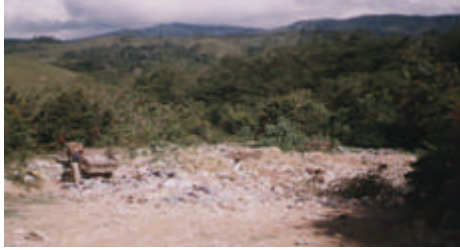
FIGURA 10: Botadero de basura existente sin tecnificación

Matadero: Existe las instalaciones de un matadero , cuyo proceso de sacrificio se realiza de una forma rudimentaria y antihigiénica. Está ubicado a orillas de la quebrada gramalote, por lo que los desechos llegan directamente a ésta. Así como se da el sacrificio, es vendida a través de famas improvisadas en algunas viviendas sin ninguna medida sanitaria.