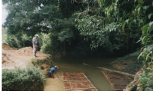
FIGURA 6 : Transporte de la madera a través del río Inanea.