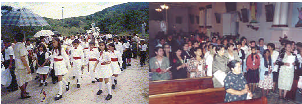
Foto 1-39 la Fiesta de la Virgen del Triunfo Foto 1-40 Rosario de Aurora Día de la Mujer