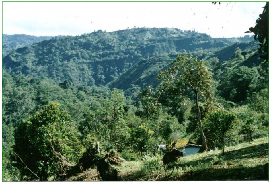
Subcuenca de la Quebrada Perdiguiz - Vereda el Dátil