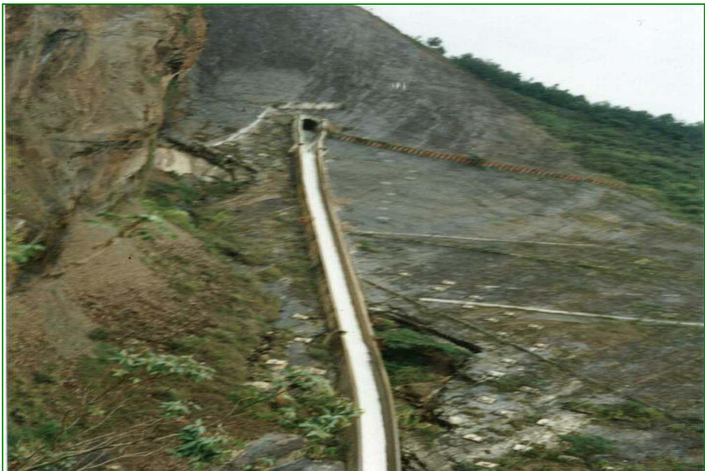
Erosión basal originada por el agua del canal Tunjita - Volador