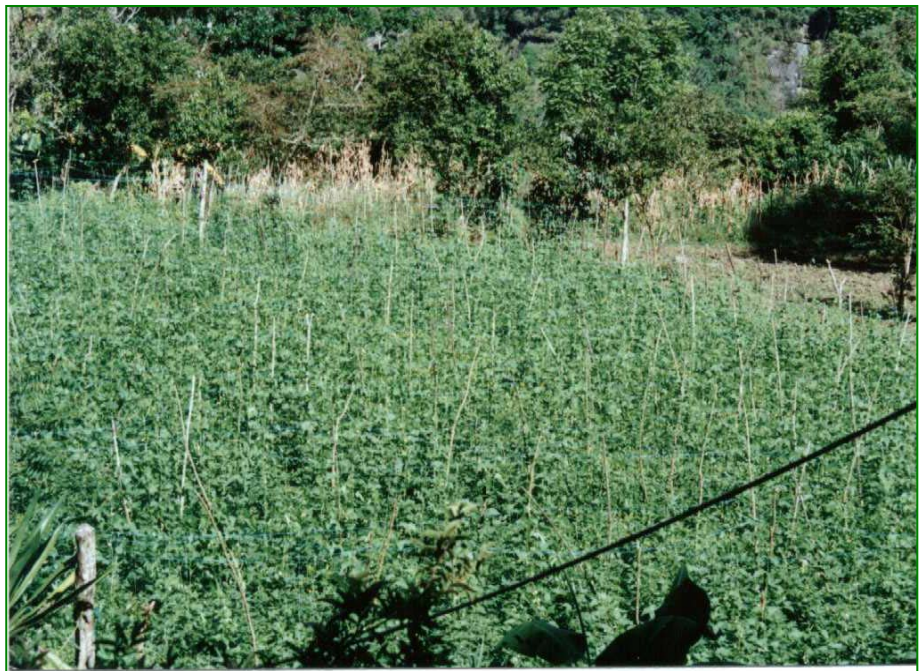
Suelos cultivados con habichuela - Vereda El Dátil Macanal