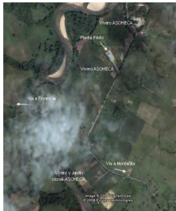
FIGURA 5. VISTA AEREA DE JARDÍN CLONAL ASOHECA