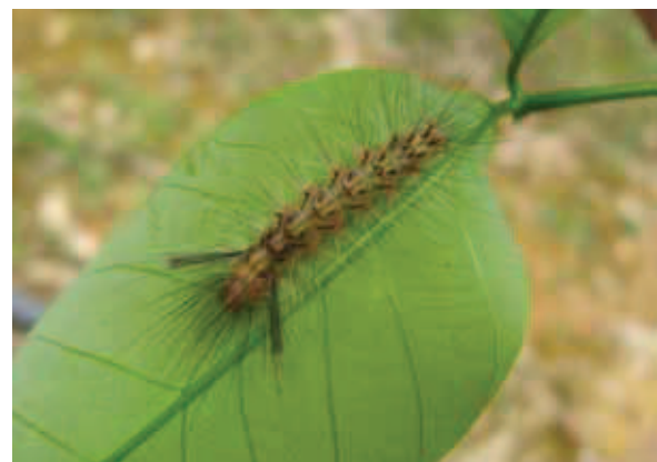
FIGURA 1. PRINCIPALES ARTRÓPODOS-PLAGA ASOCIADOS A UNA PARCELA POLICLONAL DE H. BRASILIENSIS SITUADA EN LA LOCALIDAD DE ITARCA (MONTAÑITA, CAQUETÁ – AMAZONIA COLOMBIANA). A. HORMIGA ARRIERA ( ATTA SP.). B. GUSANO CACHÓN ( E. ELLO ). C. CHINCHE DE ENCAJE ( L. HEVEAE ). D. GUSANO PELUDO ( P. SEMIRRUF A). FOTOGRAFÍAS: LOS AUTORES.