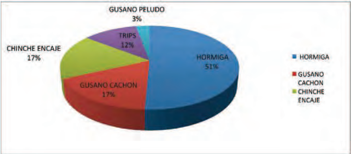
FIGURA 2. INCIDENCIA (%) DE LOS PRINCIPALES ARTRÓPODOS-PLAGA PRESENTES EN UNA PARCELA POLICLONAL DE H. BRASILIENSIS EN LA AMAZONIA COLOMBIANA) DESPUÉS DE 13 MESES DE SEGUIMIENTO.