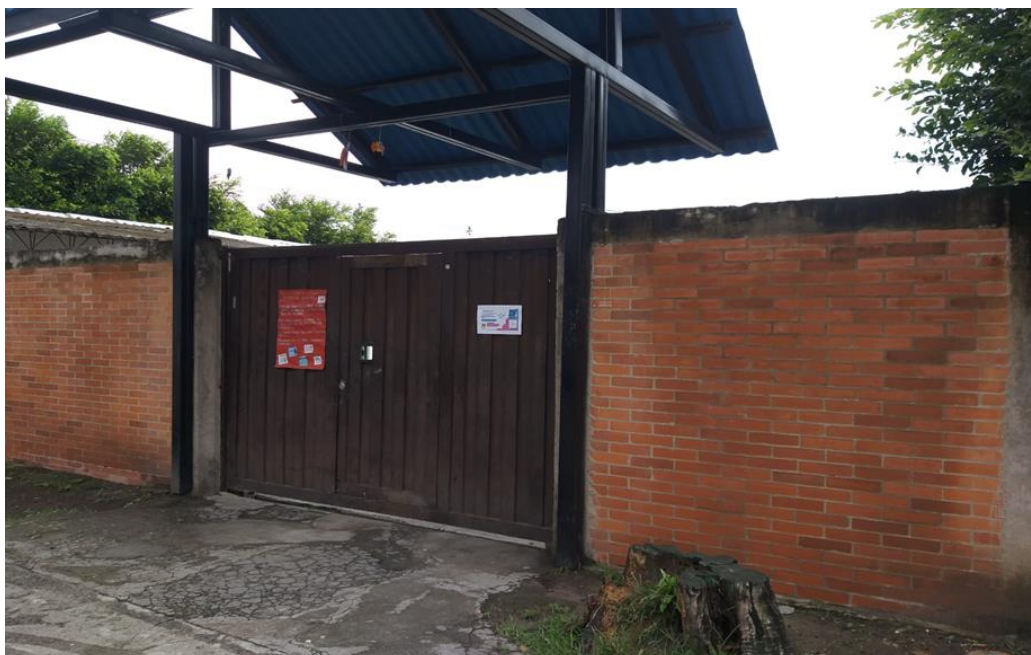
Fachada sede José María – Institución Educativa Técnica Antonio Reyes Umaña.