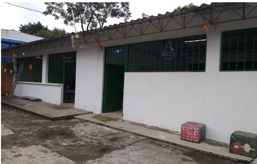
Aulas Sede José María Carbonell