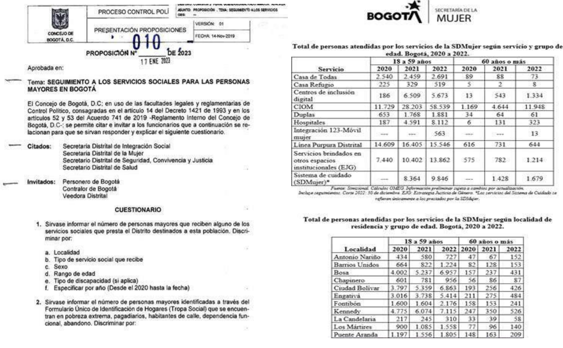
Gráfica 6. Proposición No. 010 de 17 de enero del 2023.