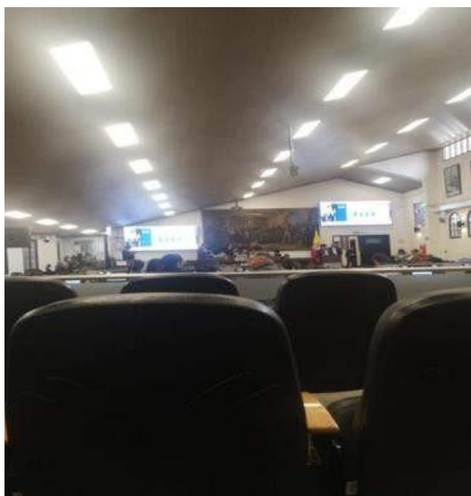
Gráfica 3. Debate de la Comisión de Hacienda y Crédito Público.