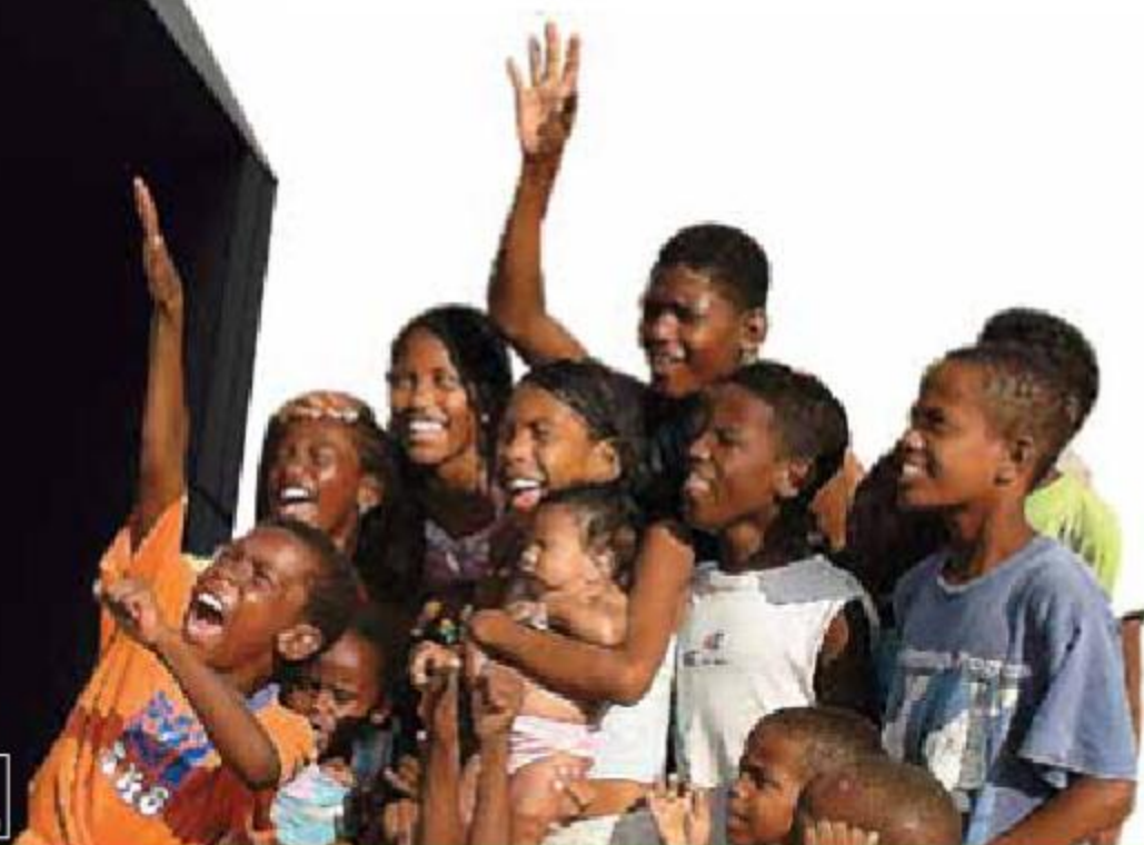
Fotografía: Acompañamiento social Proyecto Playa Blanca Barú

SUPERINTENDENCIA FINANCIERA DE COLOMBIA VIGILADO