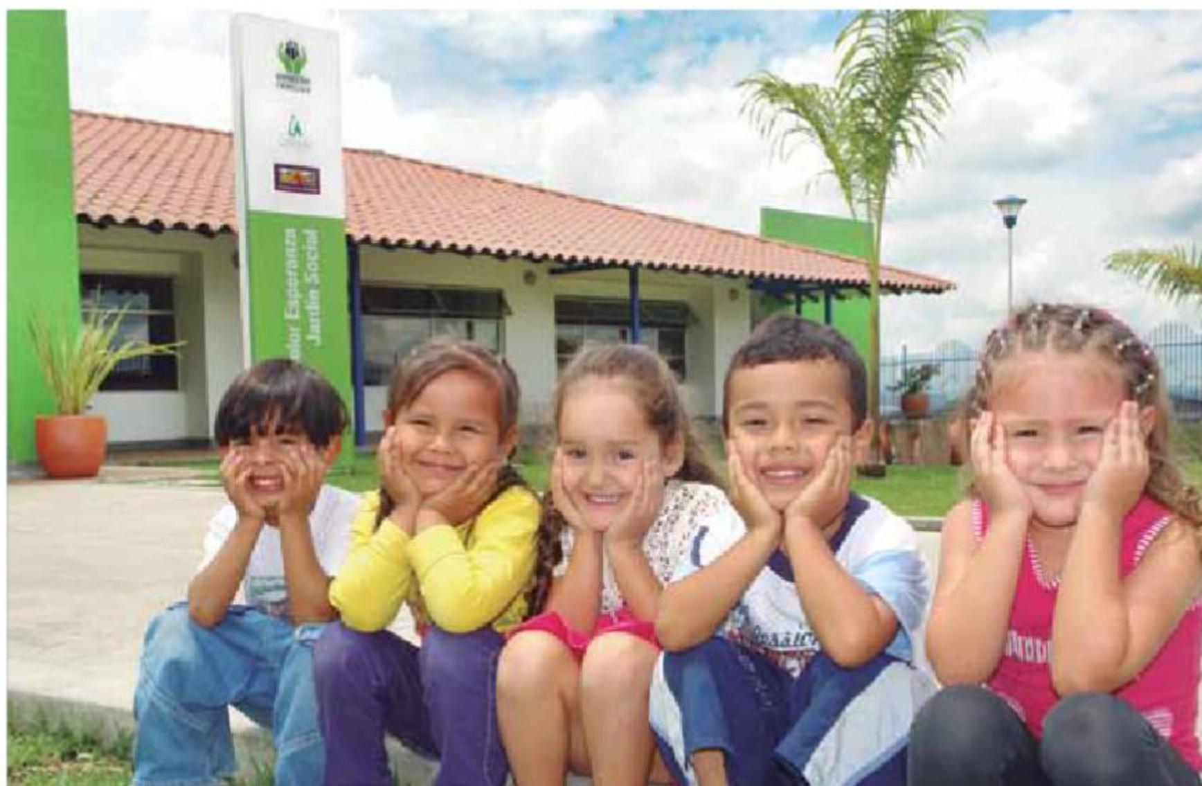
Jardín Social, Color Esperanza. Armenia - Quindío

la política social y por ser una de las 25 entidades que conforman la Red Unidos para luchar contra la pobreza, tiene una misión sagrada. Bienestar Familiar es pionero en programas de protección a la niñez y la familia, logrando llegar con sus servicios a todos los rincones de la patria. Es el corazón de Colombia y se ha convertido en el instrumento de solidaridad y equidad más importante del País.