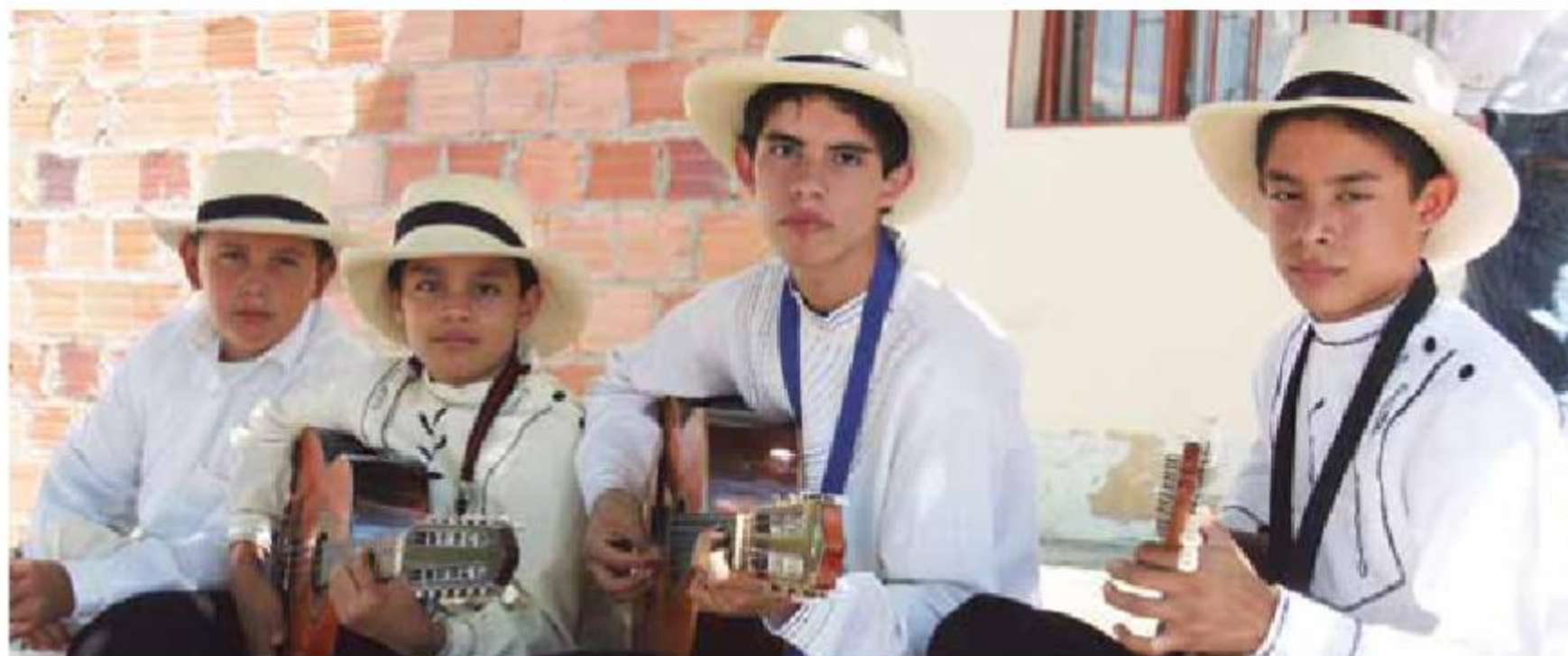
Puente Nacional, Festival del Torbellino y el Requito.

El componente cultural del plan de desarrollo municipal debe articularse al Plan Nacional de Desarrollo, formular las metas, indicadores y programas para garantizar el mejoramiento social y cultural de sus habitantes.