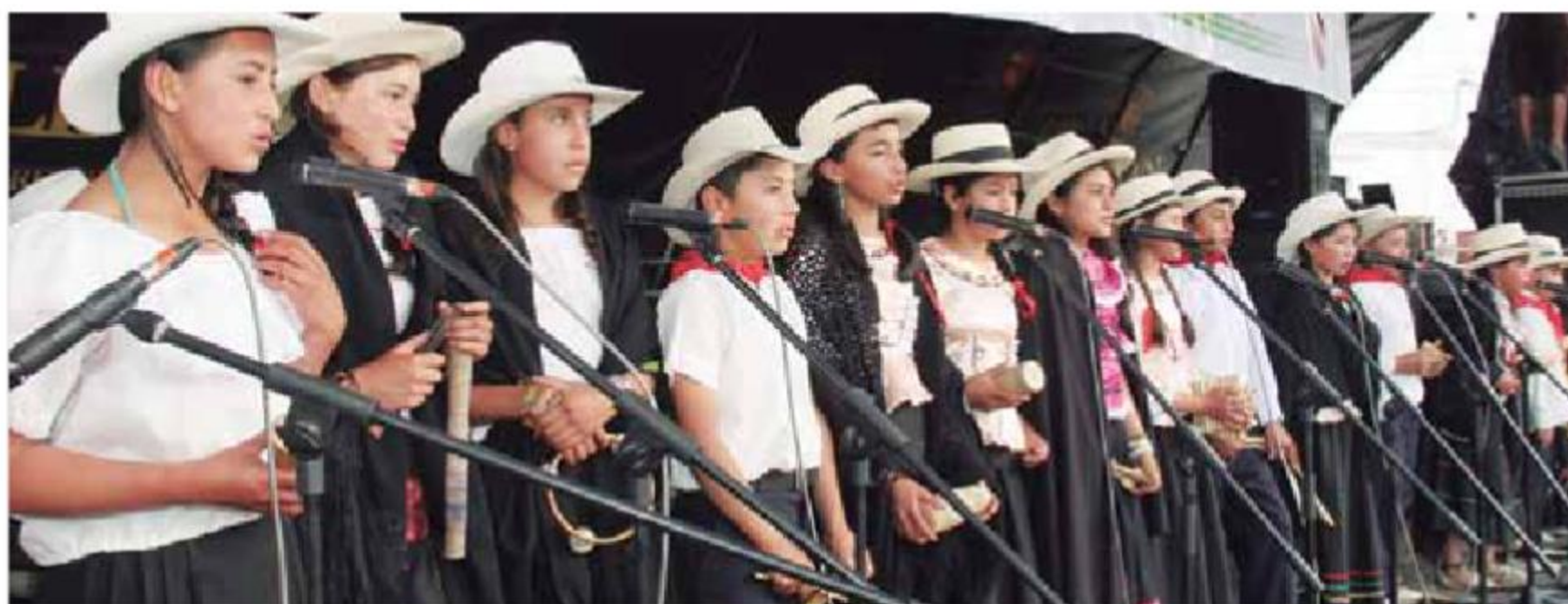
Puente Nacional, Festival del Torbellino y el Requito.