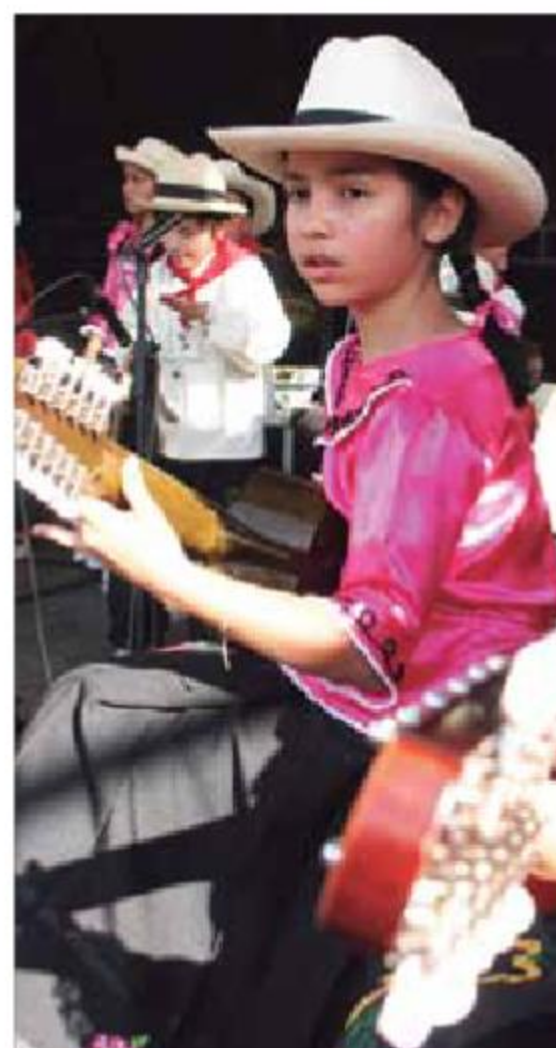
Puente Nacional, Festival del Torbellino y el Requinto.

Con el propósito de facilitar la determinación e inclusión de contenidos culturales en el plan de desarrollo territorial coherentes con la normatividad y las políticas nacionales, se recomienda considerar la siguiente propuesta de sub-programas en cultura: