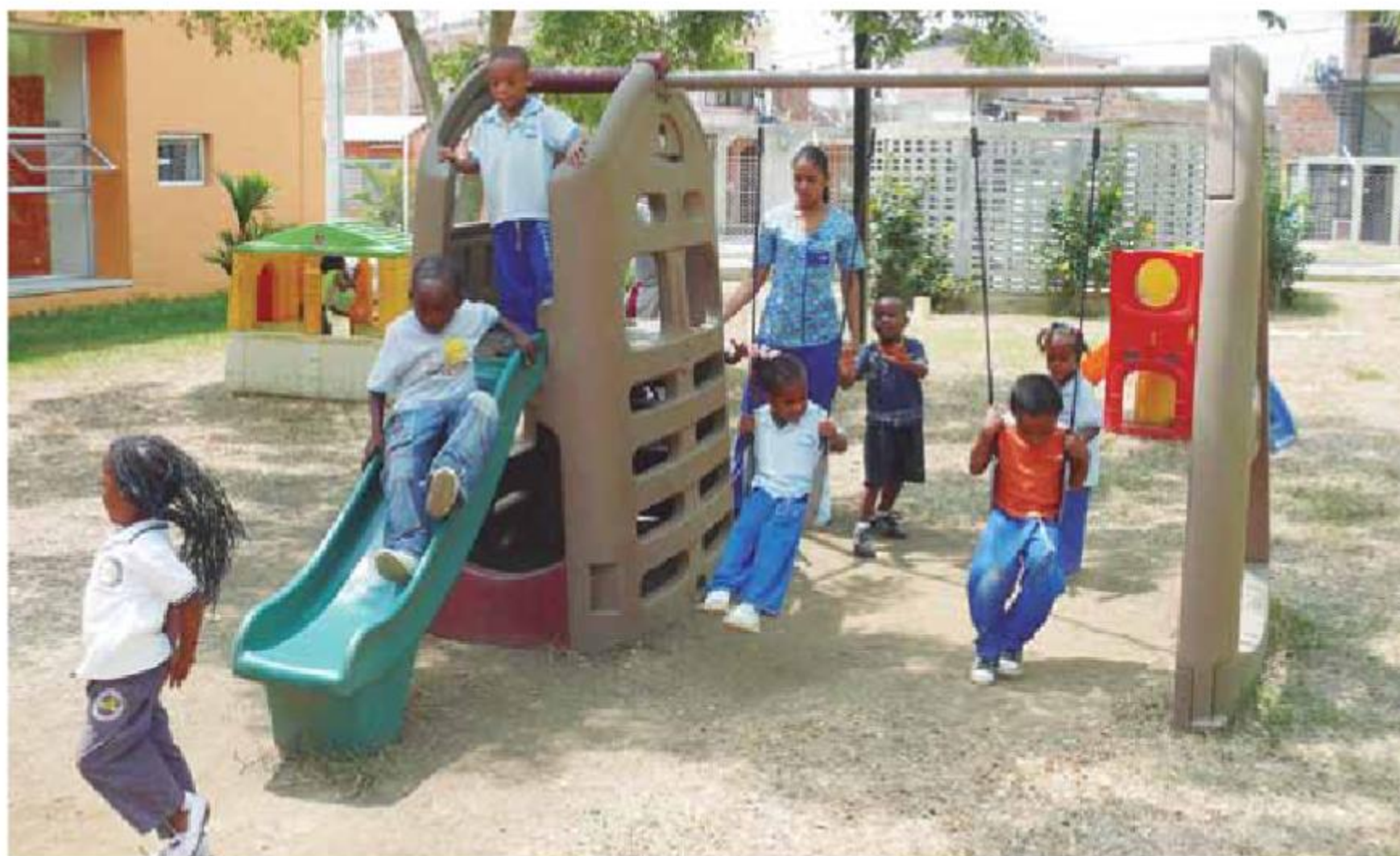
Jardín Social, El Paraiso. Cali - Valle del Cauca.

► La tercera , el apoyo del retorno de víctimas a las áreas rurales. El ICBF debe ser el eje de la reparación y reconciliación de los niños, los jóvenes y sus familias que retoman a las tierras que nunca debieron abandonar.