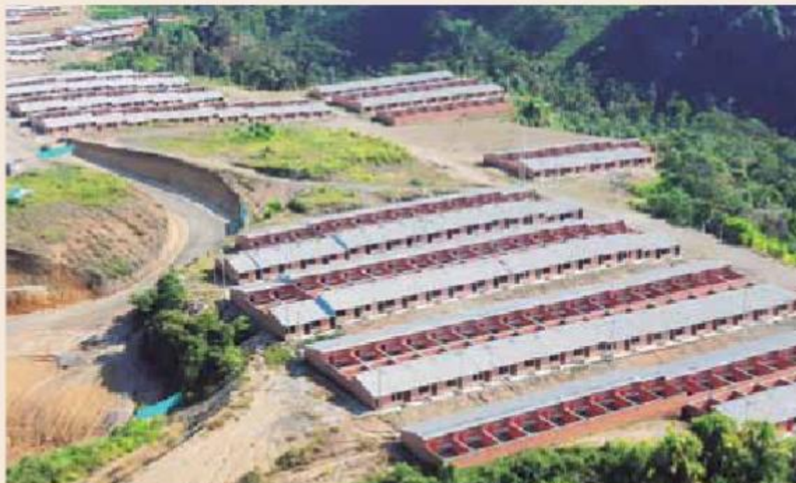
Ciudadela El Remanso, Pereira.

El Ministerio de Vivienda, Ciudad y Territorio define las metas, las estrategias y el rol de las entidades territoriales en temas relevantes para el desarrollo y la calidad de vida de sus habitantes.