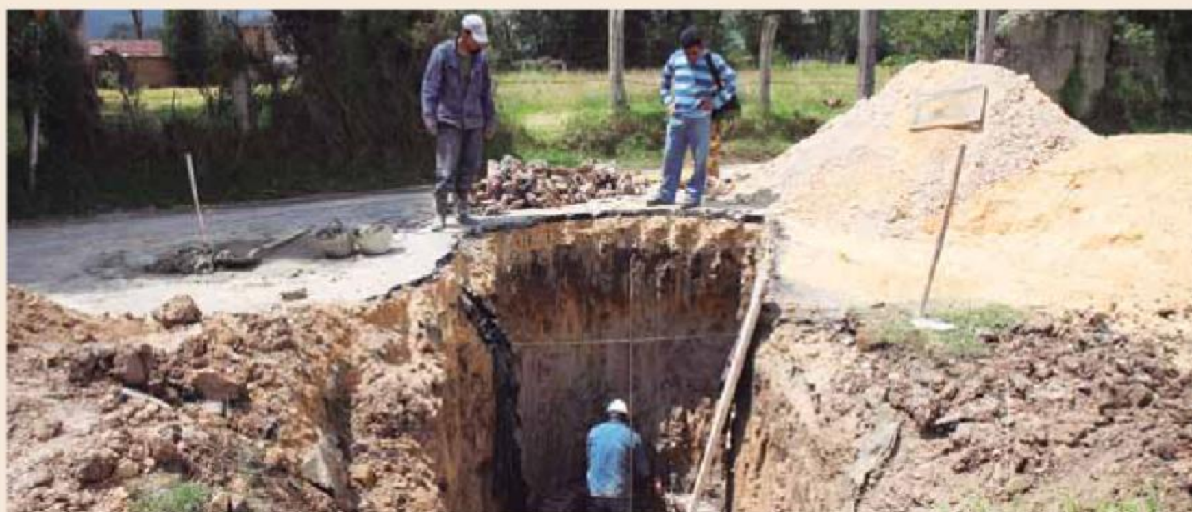
Expansión del alcantarillado en Cajicá, Cundinamarca.