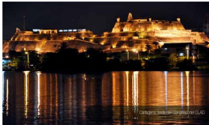
Cartagena, sede del Congreso del CLAD

Más información en: E-mail: clad@clad.org http://congreso.clad.org