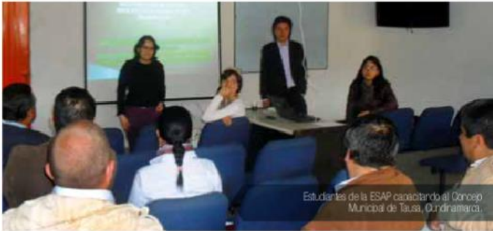
Estudiantes de la ESAP consultando al Concejo Municipal de Tusa, Quindío.