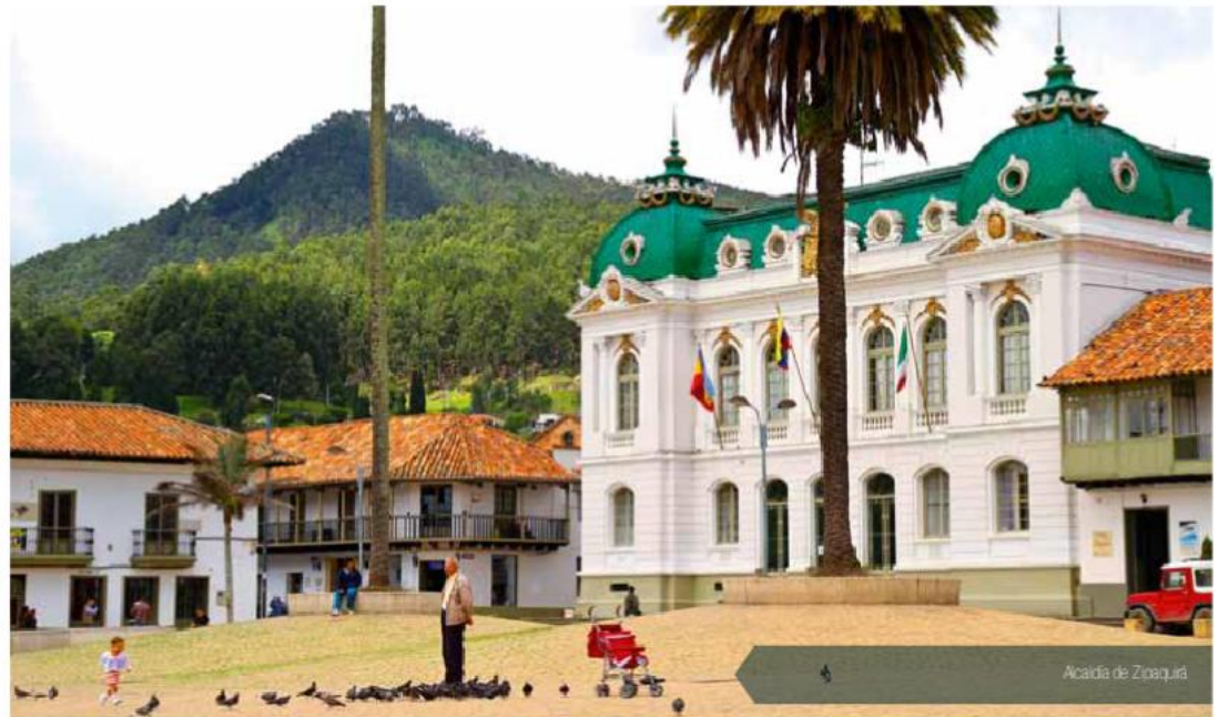
Acadía de Zoqueira