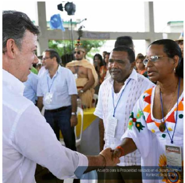
Acuerdo para la Prosperidad realizado en el departamento fronterizo de la Guayana.

Hoy más que nunca el país está entrando en una nueva era comercial de la mano con el Tratado de Libre Comercio (TLC) con los Estados Unidos, el cual fue aprobado el pasado 15 de mayo, y la Unión Europea, el cual se encuentra en aprobación, además de los nueve