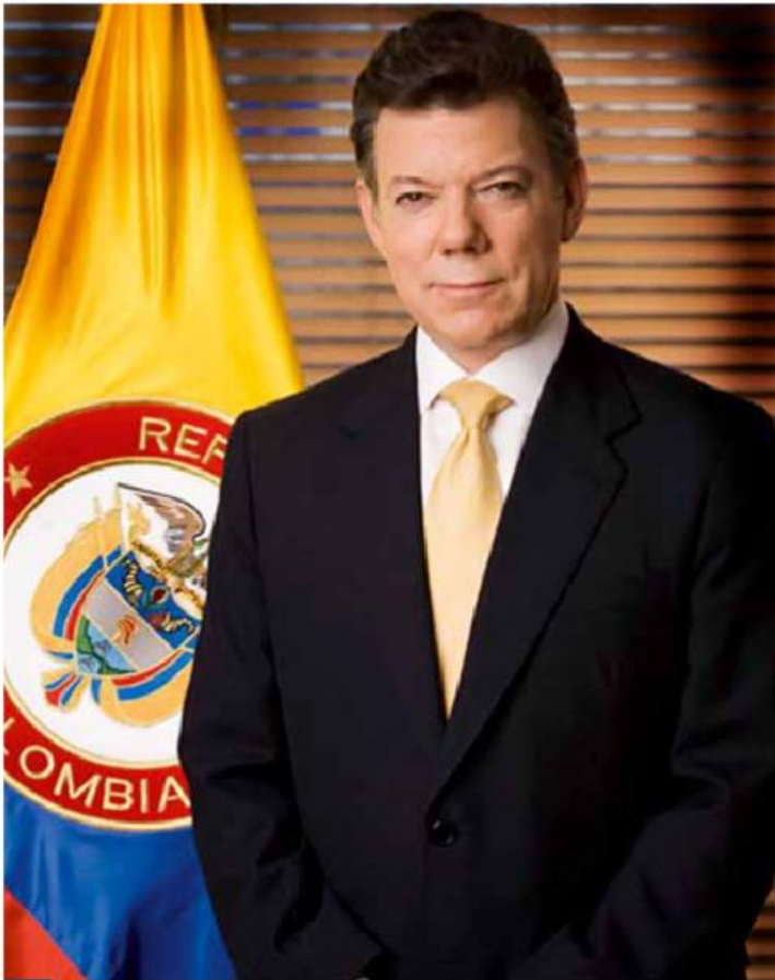
● Juan Manuel Santos Calderón Presidente de la República

Transparencia, eficiencia, eficacia y rendición de cuentas: Claves para el Buen Gobierno.