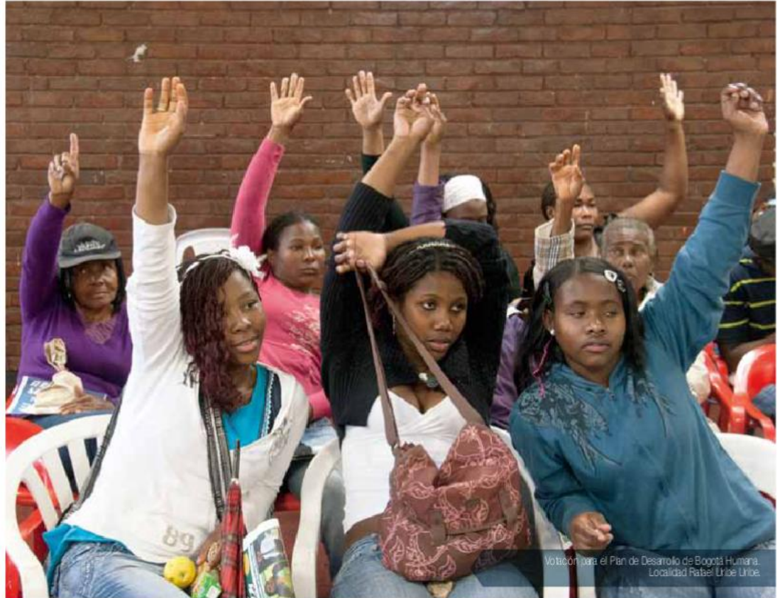
Votación para el Plan de Desarrollo de Bogotá Humana. Localidad Rafael Uribe Uribe.

Así como la población de una entidad territorial es heterogénea, su territorio también es heterogéneo y diverso; por lo tanto, los planes de desarrollo deben tener una mirada regional de la entidad territorial, diferenciando las problemáticas y potencialidades de las diferentes zonas del municipio.