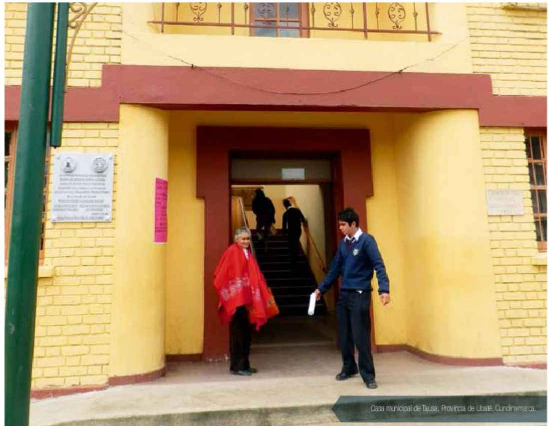
Casa municipal de Tausa, Provincia de Ubaté, Cundinamarca.

En total son 20 los municipios de Cundinamarca que se benefician con este proyecto y estos se encuentran distribuidos entre las siguientes provincias así: