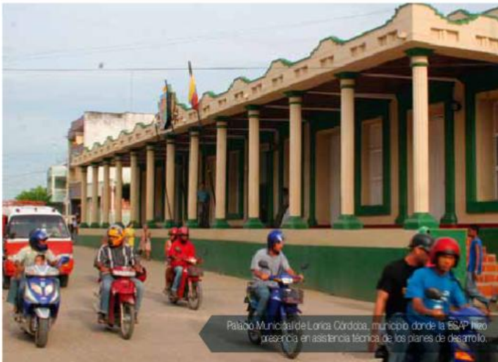
Palatio Municipal de Llorca Córdoba, municipio donde la ESAP hizo presencia en asistencia técnica de los planes de desarrollo.