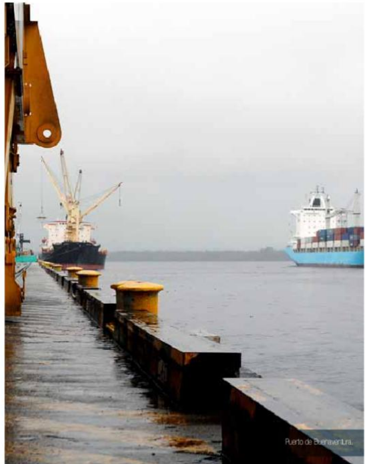
Puerto de Buenaventura.

Según la exministra y exsenadora Cecilia López, "el TLC con Estados Unidos fue mal negociado, porque no se defendieron convenientemente sectores como el de la salud y el agropecuario".