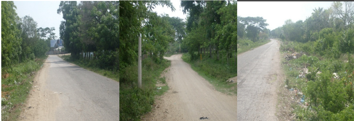
BUENAVISTA – PROVIDENCIA