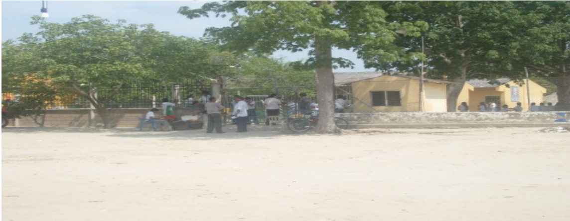
Colegio Bachillerato del Municipio de Buenavista

En el municipio se ofrece educación preescolar, básica primaria y secundaria, en once (11) establecimientos educativos del sector oficial, los cuales están distribuidos de la siguiente manera: siete (7) establecimientos de Educación Básica Primaria en la zona rural; tres establecimientos de Educación Básica Primaria y Preescolar y un (1) establecimiento de Educación Secundaria en la zona urbana con una extensión en el corregimiento de Las Chichas.