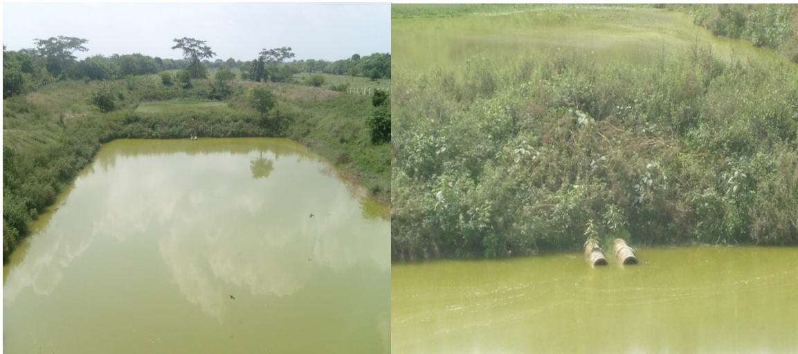
Lagunas de oxidación

La red del sistema de alcantarillado desemboca en una laguna de oxidación, ubicada en la margen norte de la vía que comunica la cabecera municipal con el corregimiento de Juan Arias – Magangué (Bol.). El tratamiento que se le da a las aguas servidas es deficiente originando serios problemas de contaminación y salubridad pública, actualmente existe un proyecto del nuevo sistema de acueducto y alcantarillado elaborado por la administración municipal el cual se encuentra en la etapa de consecución de recursos en los diferentes entes de cofinanciación. Estos servicios son prestados por el municipio a través de la empresa “AGUAVISTA E.S.P”. (Ver Plano 6 Servicios Saneamiento Ambiental.)