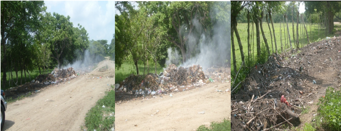
Relleno a cielo Abierto o Botadero de residuos solidos

El servicio como tal se presta en óptimas condiciones de acuerdo a las necesidades, pero no lo es así, en el sitio de disposición final, el cual es un gran foco de contaminación ambiental en todo el sector. Dentro de los propósitos del ajuste del EOT, es analizar una estratégica para la ubicación del relleno sanitario fuera del perímetro urbano que cumpla con parámetros ambientales de Ley.