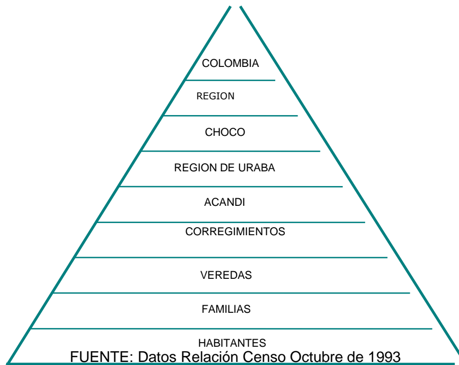
FIGURA ..... NIVELES JERARQUICOS ESPACIALES DEL ENTORNO URBANO REGIONAL DE ACANDI (CHOCO)

Las relaciones de Acandí con su entorno han demostrado la existencia de 3 polos importantes de atracción en los cuales se desarrollan la mayoría de las funciones del municipio, estos son: Turbo, Quibdó y Cartagena y