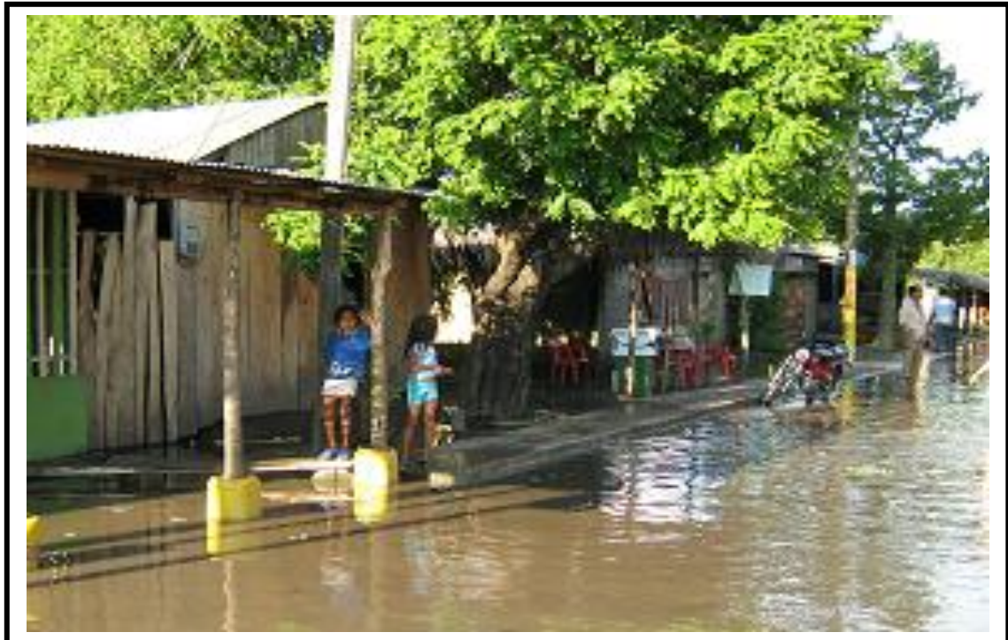
FOTO: INUNDACION NOVIEMBRE DE 2007.

Realizando un trabajo con la comunidad, se señalaron los lugares más afectados por la dinámica natural de inundaciones del Río y las ciénagas y se identifican algunas posibles soluciones para mantener la convivencia entre el ecosistema natural y la población del municipio de Pinillos.