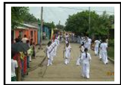
Foto 1, 2 y 3. Alumnos Institución Educativa Manuel Francisco Obregón