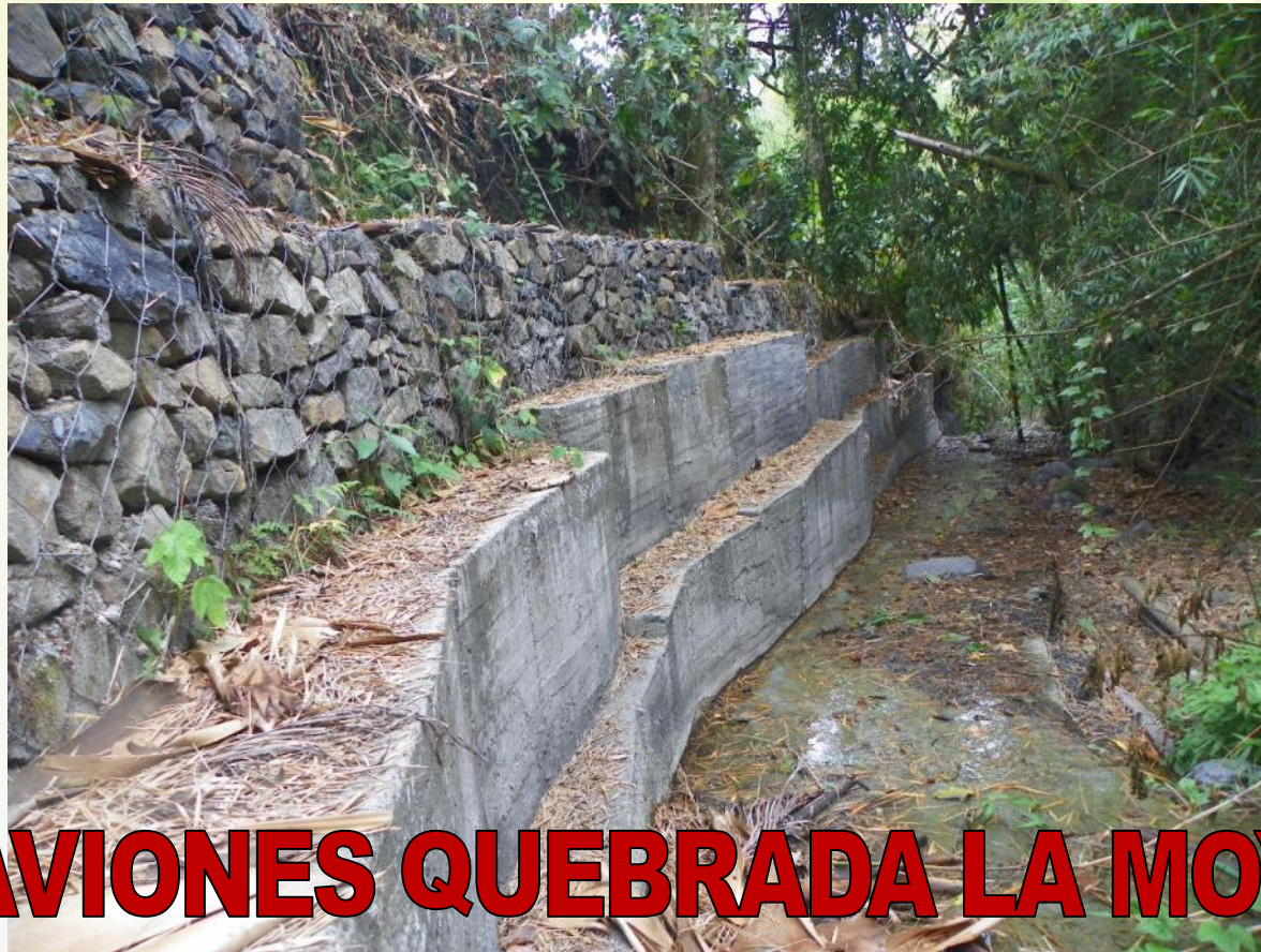
GAVIONES QUEBRADA LA MOYA