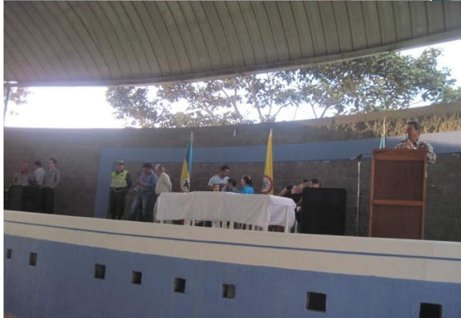
Iniciación de la Olimpiada como Tal: