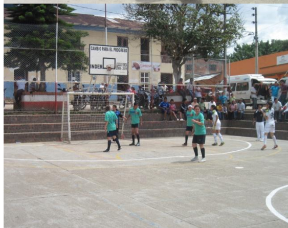
Final Departamental Mil Ciudades Futbol de Salón en San Bernardo: