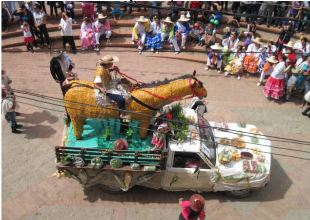
Desfile de Carrozas y Comparsas: