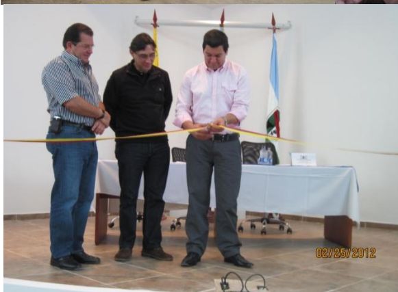
Viernes Cultural Adulto Mayor:

Calle 6 No. 3A -16/28 Teléfonos 8680 708 celular 3104770250