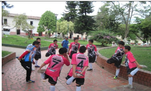
Departamental Futbol de Salón Femenino: