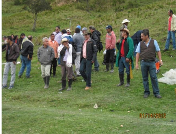
Inauguración Casa de la Cultura: