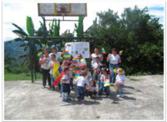
PROGRAMA CRE - SER HOY ANUTRIR

DURANTE EL AÑO 2012 SE ENTREGARON 492 RACIONES A LOS BENEFICIARIOS