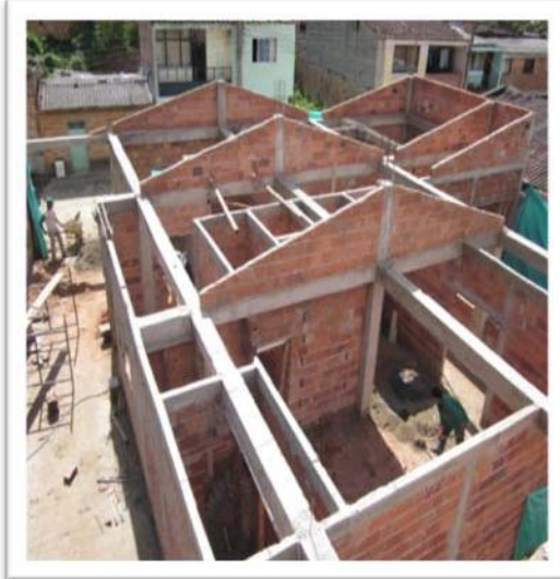
EN CONSTRUCCIÓN – VISTA SUPERIOR