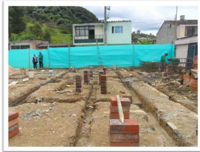
EXCAVACIONES PARA VIGAS DE AMARRE