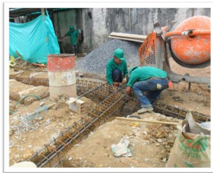
INSTALACIÓN DE HIERRO PARA VIGAS DE AMARRE