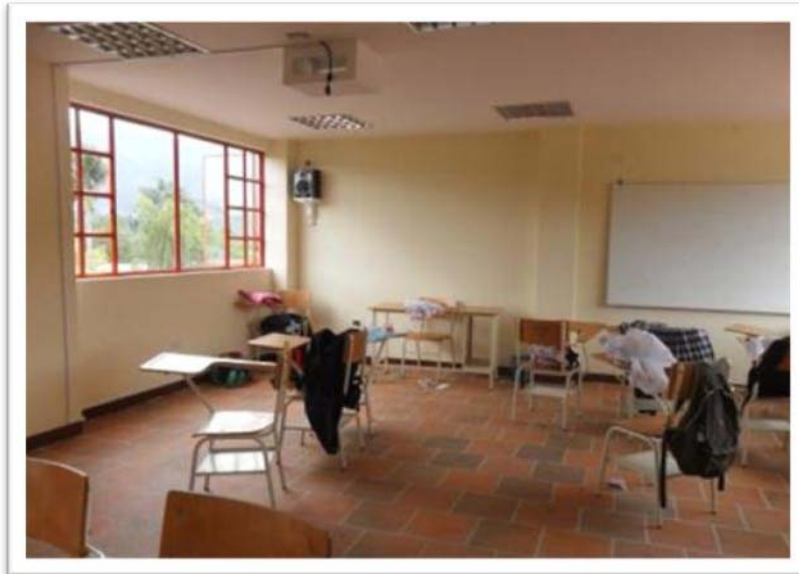
AULA ESCOLAR SEGUNDO PISO