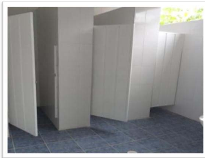
VISTA INTERIOR BAÑOS