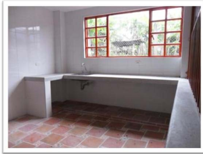
VISTA INTERIOR COCINA