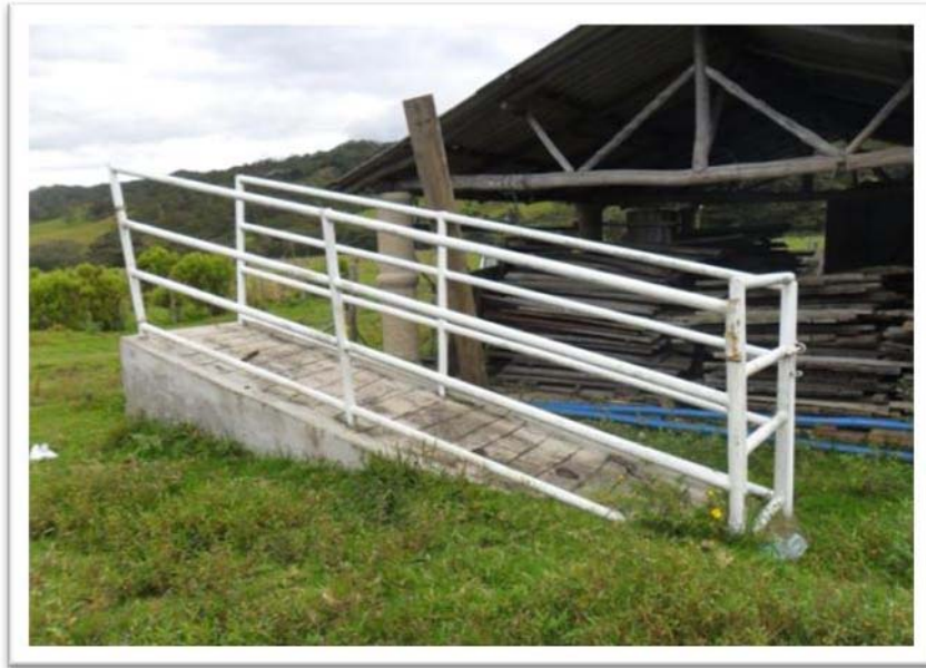
RAMPA PARA PESAJE