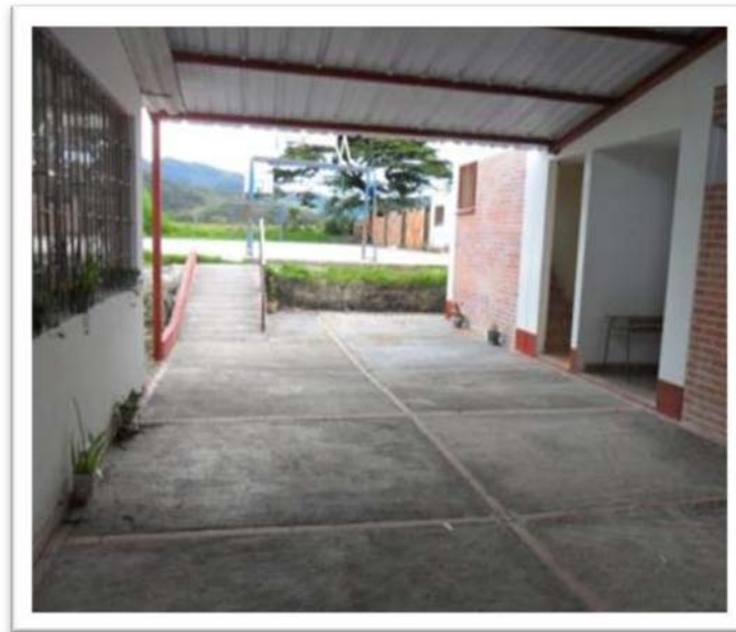
PISO Y CUBIERTA PARA USO DE COMEDOR INFANTIL