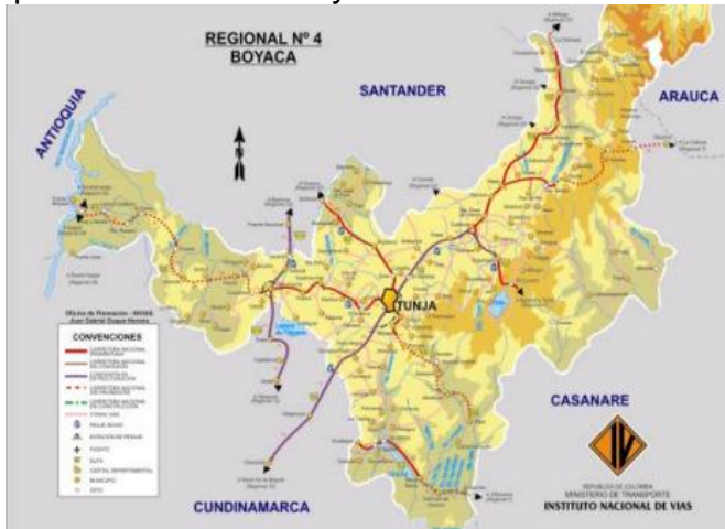
Mapa N° 1. Red vial Boyacá