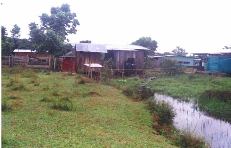
Foto 5. Fuentes abastecedoras directas de agua para consumo humano. Piamonte 2001 5

3.8.2.1.1 Microcuenca Quebrada Barbasco. La micro cuenca La Barbasco está proyectada ser una fuente abastecedora del acueducto de la cabecera municipal, tiene un área aproximada de 12 km 2 . Su cauce principal tiene una longitud aproximada de 8.8 Km. Su recorrido va de Occidente a Sur Este.