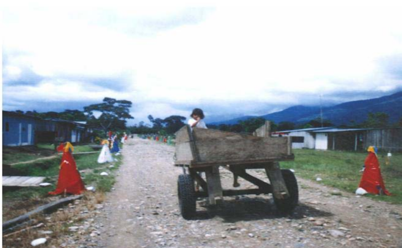
Foto 4. Celebración del Alumbrado, 7 de diciembre. Piamonte 2001

Por otra parte, cada año, tres días antes del miércoles de ceniza se lleva a cabo entre los indígenas ingas, la celebración del carnaval tradicional; en esta fiesta se conmemora la reconciliación y reencuentro entre los miembros de la comunidad, animada con música que se interpreta con instrumentos tradicionales, danzas autóctonas y vestuario especial. El hombre usa un camión de color blanco bordado en sus extremos, denominado “cusma”. Las mujeres usan la “pacha”, que es una prenda de color negro ajustada a la cintura con una faja o “chumbe”, (pieza tejida en lana de colores vivos y con una simbología representativa) quedando a manera de falda y el “tupulle” o blusa de color negro ajustada a los hombros con gancho. Adicionan a este vestuario, tanto hombres como mujeres, collares de colores llamativos llamados “chaquiras” o pañuelo rojo para los hombres, en caso de no tener collares.