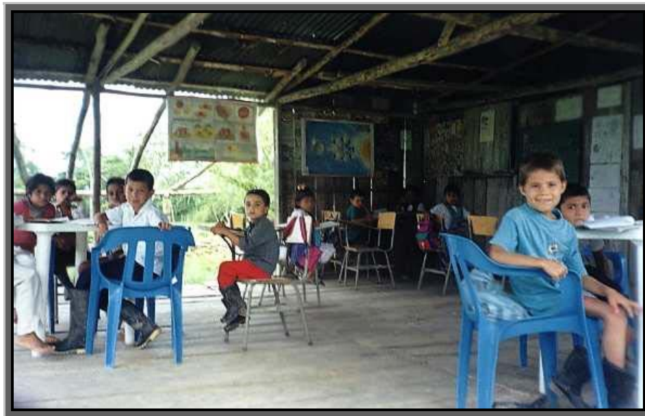
Foto 2. Escuela en la Vereda el Palmito, Yapurá. (foto Carlos A Gómez).