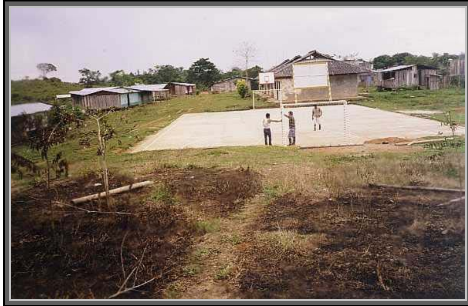
Foto 3. polideportivo para la practica de fútbol y baloncesto en el corregimiento de Yapurá.