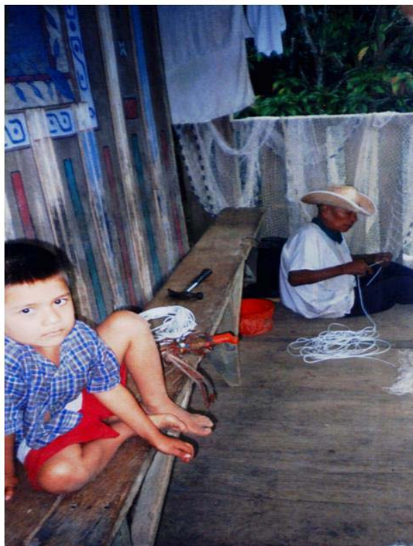
Foto 10. Elaboración artesanal de atarrayas por los Inganos. La floresta, 2002.

conocimiento de la reproducción del medio como fundamento de su propia reproducción social. Por otra parte, dicho sistema articula experiencias y conocimientos materiales sociales y de su cosmovisión, de manera que la sociedad ordena el paisaje y se organiza en este acorde con su cultura. Entonces en cuanto las comunidades se apropian material y culturalmente del espacio, lo socializa; el paisaje deja de ser silvestre, es un producto cultural. Por ello mismo no es sólo el medio de producción "tierra", es territorio. (Esta reflexión hace parte de una reunión con db SIG Geólogos Consultores LTDA, en que los Inganos de Piamonte explican el proceso que adelantan respecto a la conformación de sus resguardos. Mocoa 2002).