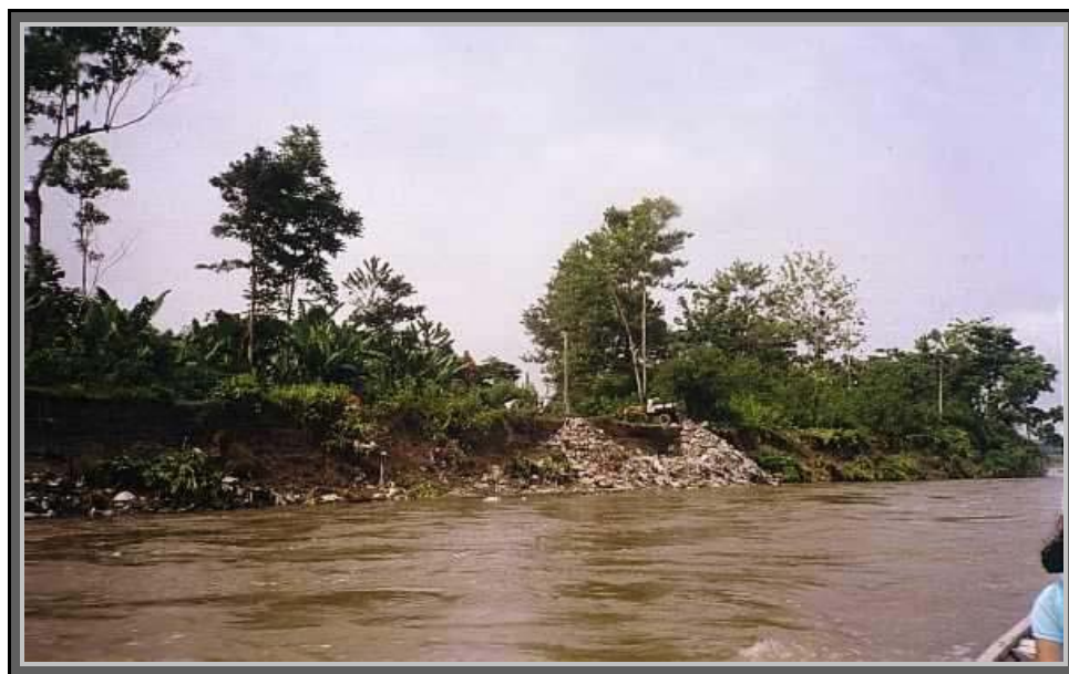
Foto 6. Disposición de basuras sobre Río Caquetá.

En Piamonte los residuos sólidos se consideran un problema de salud pública, sin embargo, aún no se tiene la conciencia de un manejo adecuado de las basuras. Algunos de los habitantes en la zona rural practican las quemas, principalmente de papeles y