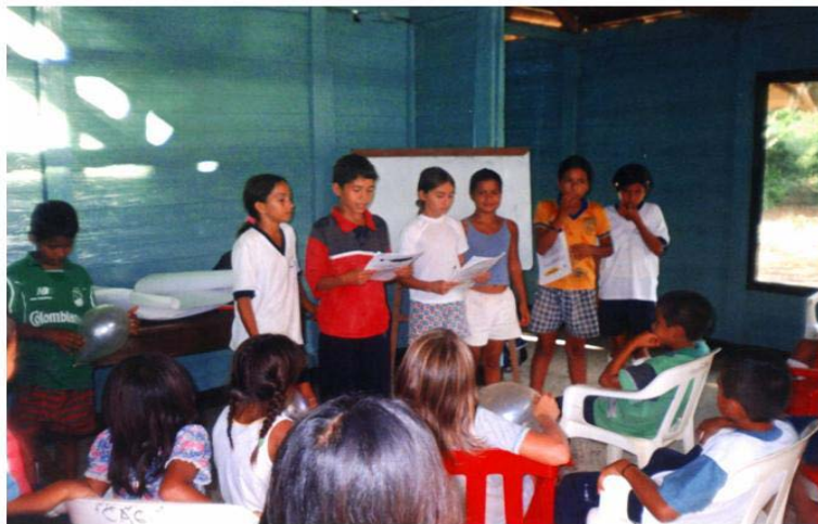
Foto 1. Taller organizado entre db Sig Geólogos Consultores y FUNAMBIENTE con los Niños pertenecientes a GAMA. Centro Agroforestal Guayuyaco, 2002

3.1.5 Educación No formal. En el Municipio de Piamonte, FUNAMBIENTE viene desarrollando dentro de su función social el proyecto GAMA (Grupo de Amigos del Medio Ambiente), el cual se desarrolla con 20 niños aproximadamente, del corregimiento de Miraflores. Los encuentros se hacen en el Centro Agroforestal Guayuyaco los días Miércoles y sábados. Las actividades de este grupo se centran principalmente en valorar, cuidar y respetar la naturaleza, también es un espacio que les permite incentivar una conciencia ciudadana, sentirse útiles e importantes, mantener vínculos de amistad y recrearse. El programa contempla la posibilidad de ampliar el número de integrantes y busca además vincular adolescentes con el fin de darles la oportunidad de ocupar su tiempo libre transmitiendo los conocimientos y reproduciendo las actividades de talleres de educación ambiental y siembra de árboles en las diferentes escuelas del municipio de Piamonte y así generar mayor impacto en la zona. (Informe de actividades Centro Agroforestal Guayuyaco. Funambiente. 2001) 2 (ver foto 1).