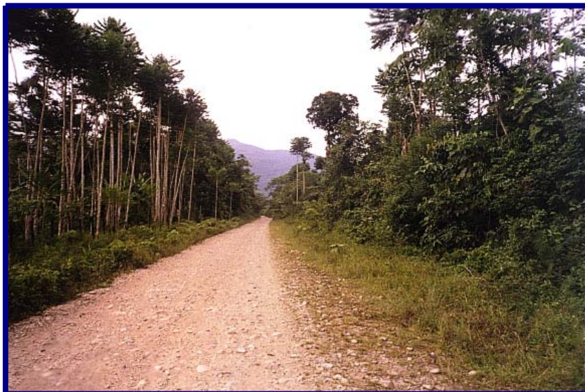
Foto 7. Vía construida por la Compañía Petrolera Argosy.

El tramo Muelle – Piamonte – Puerto Bello, cubre las veredas de La Floresta, Mirafior, San Pablo, Rumiñawi, la Palmera, el Jardín, San Isidro, Piamonte, Santa Rita y Puerto Bello. Esta vía comunica los tres pozos existentes en la zona (Mary 1 y 2 y Mirafior Norte – 1) con la cabecera municipal y diferentes veredas.