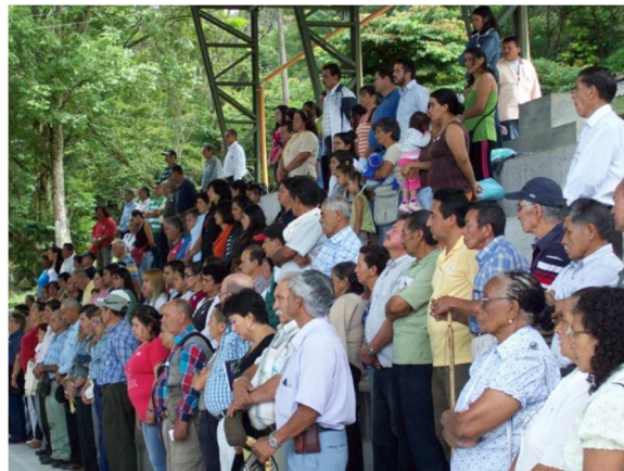
Ilustración 5 Taller Inspección de Pradilla

Dado lo anterior, se contó con la participación de aproximadamente 190 personas entre las que se encontraban autoridades municipales, representantes de la policía nacional, del cuerpo de bomberos, presidentes de juntas de acción comunal, representantes de gremios, comerciantes, entre otros representantes de la comunidad.