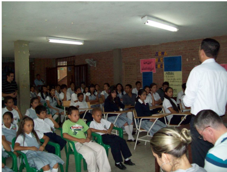
Ilustración 6 Taller Juventudes.

Dado lo anterior, se contó con la participación de aproximadamente 90 personas entre las que se encontraban autoridades municipales, estudiantes, representantes de la policía nacional, del cuerpo de bomberos, presidentes de juntas de acción comunal, representantes de gremios, comerciantes, entre otros representantes de la comunidad.