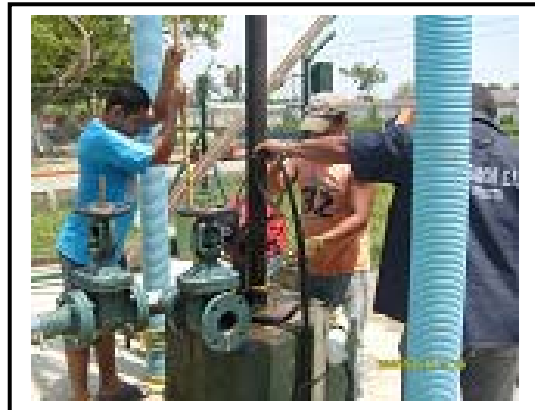
trabajadores instalando bomba acueducto