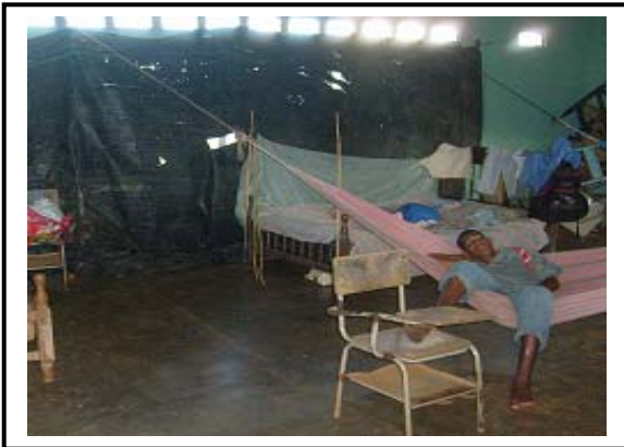
Damnificado por inundaciones