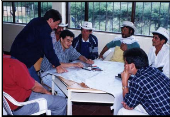
Fotos 3: Reuniones diagnóstico Funcional en el la Vereda Siempre Viva.