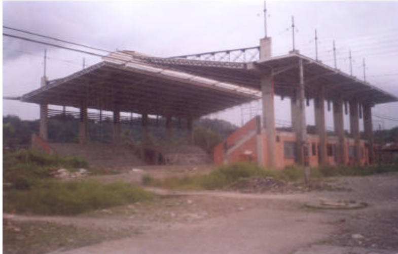
Polideportivo López de Micay