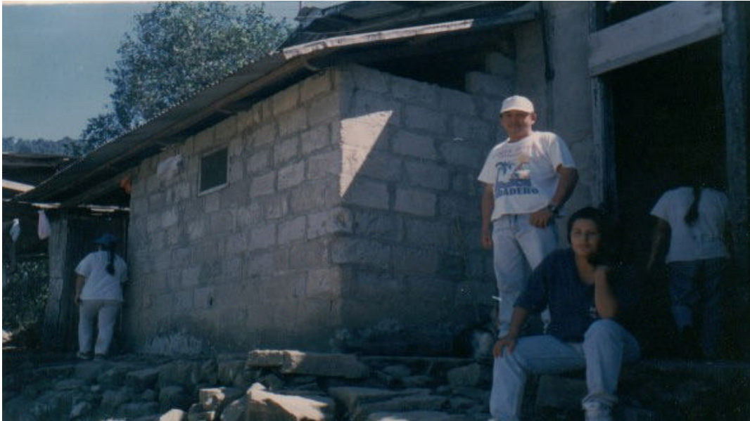
FOTO: VIVIENDA CONSTRUIDA EN MATERIAL

Uno de los problemas de la vivienda se presenta en el área urbana representado en la ubicación y son las que se encuentran en la rivera derecha del río Cobaría.